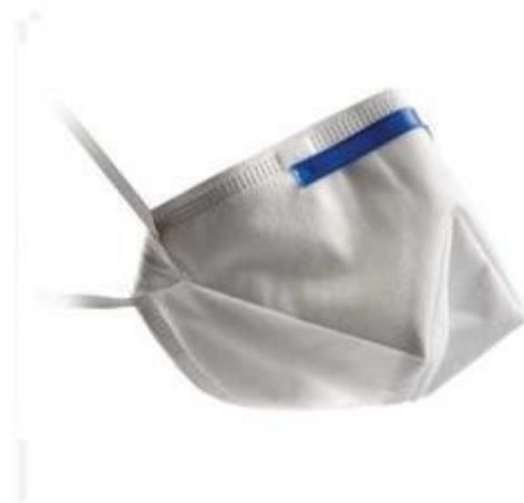
Figura 4. Mascarilla de protección tipo FFP2.