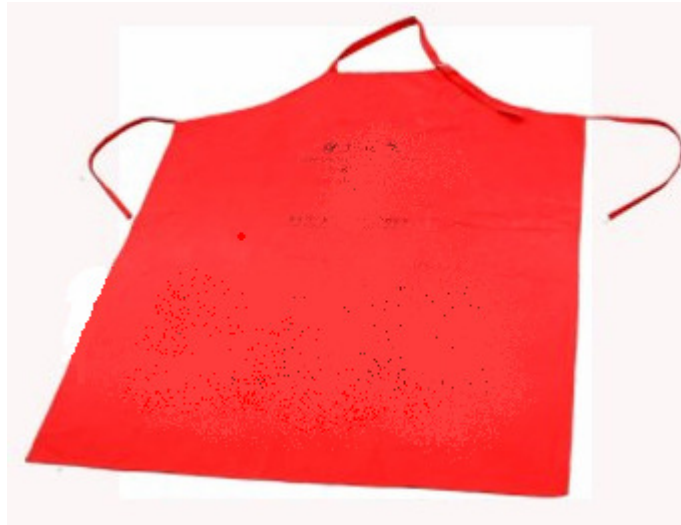
Figura 5. Mandil de protección.