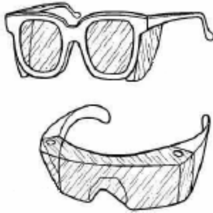
Figura 3. Gafas de seguridad.