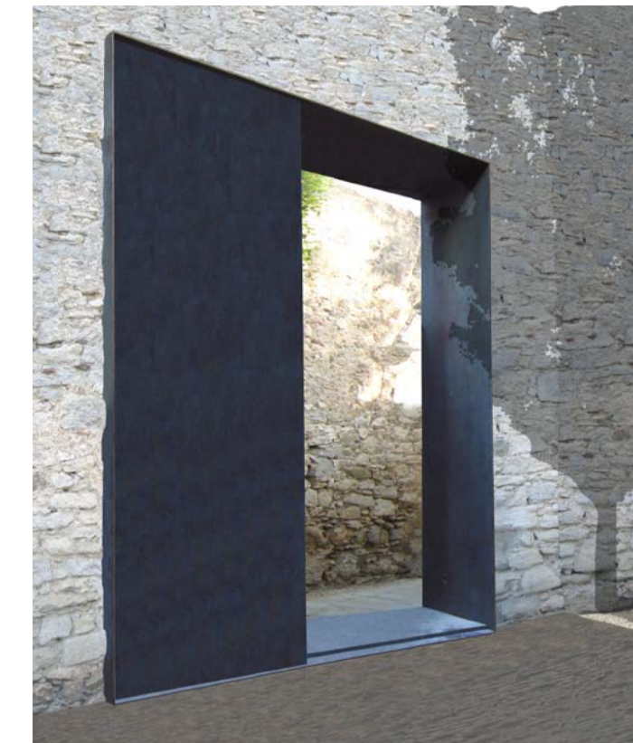
REF. 1_ FOTOMUNTATGE PORTA ENTRADA des del c/ PORTAL NOU (vista des de dins del pati_ porta corredissa)