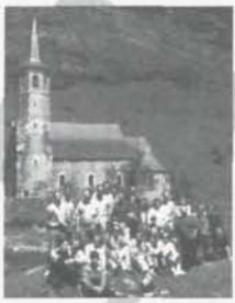
Portada: Escriptors a Montgarri