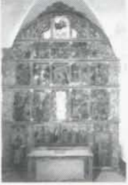
Contraportada: Retaule de Sorpe

Un cop d'ull a l'església de la Catalunya d'avui Entrevista a monsenyor Joan Martí i Alanís, bisbe d'Urgell