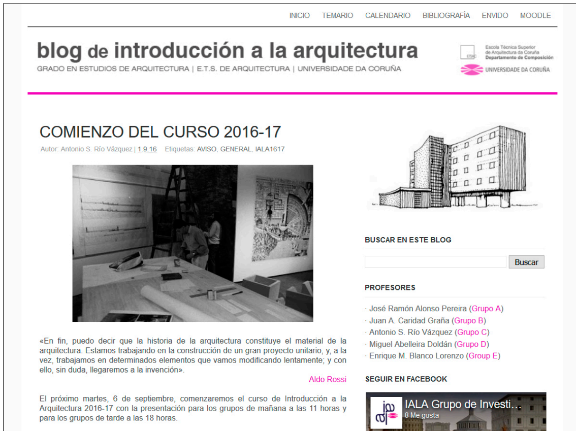
Fig. 1 El blog de la asignatura

dos blogs para la asignatura, vinculados respectivamente a las acciones temáticas regulares y de actualidad ( http://iala1011.blogspot.com ), así como el exclusivo de enunciado de prácticas ( http://iala1011p.blogspot.com ), que se convirtieron en guías centrales de la actividad; referencias constantes en lo presencial, apoyo permanente y foro de encuentro en lo no presencial. Complementariamente, la privacidad necesaria para la elaboración de prácticas individuales y originales, con un peso específico en la evaluación, fue resuelto a través de la aplicación Moodle. Esto es, utilizándolo a modo de cajón privado, con llave, frente al acceso abierto y totalmente público del resto de actividades.