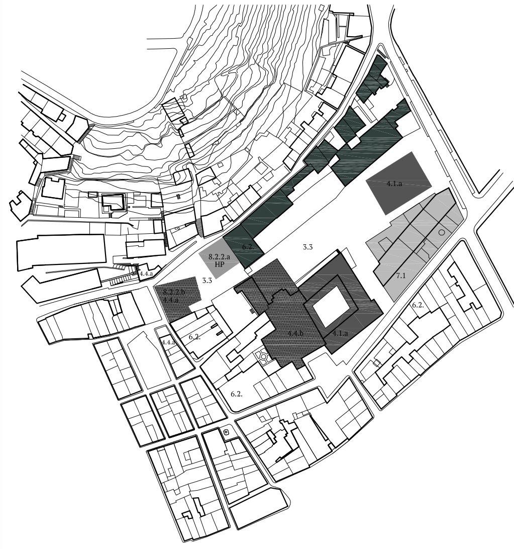
Modificació (MPOUM 2003) aprovat 2014 escala: 1/2500