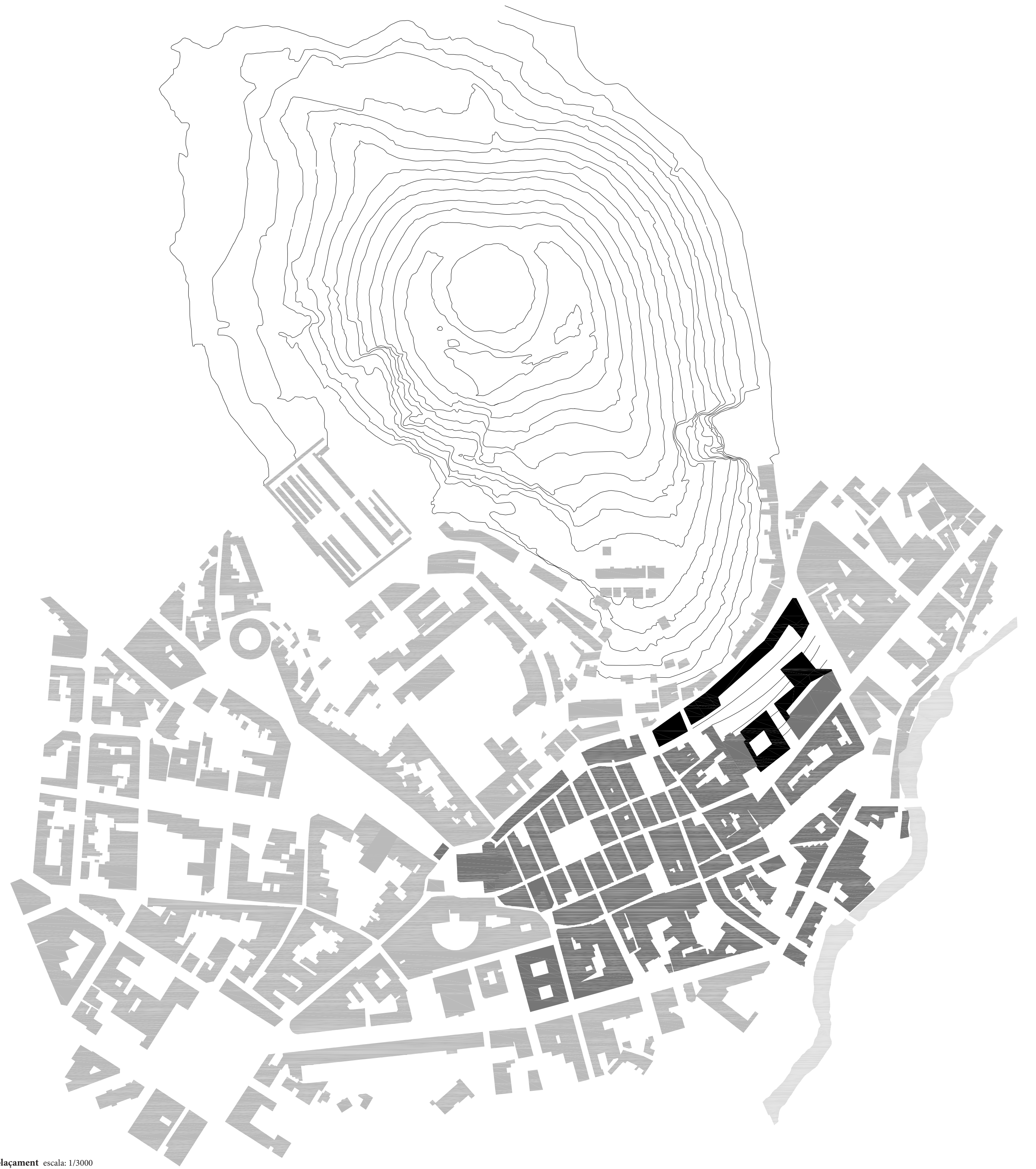
Emplaçament escala: 1/3000