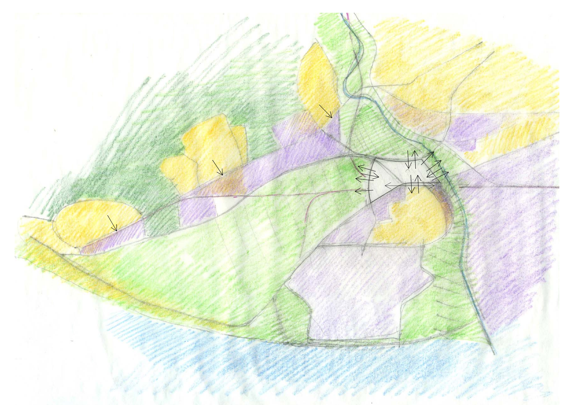
RELACIÓ ÀMBIT ACTUACIÓ I ENTORN

CONCURS D'IDEES PER A L'ORDENACIÓ DE L'ÀMBIT DEL CENTRE DIRIGENCIAL AL PRAT DE LLOBREGAT - PRAT INNOU - SCAR