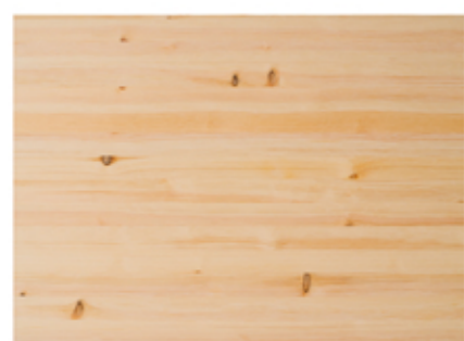
PANEL DE FUSTA DE PI en panells de 600mm

Fem servir panells de fusta de pi d'un ample de 600mm per facilitar el muntatge ja que la planta està mòdulada en franjes de 300mm.