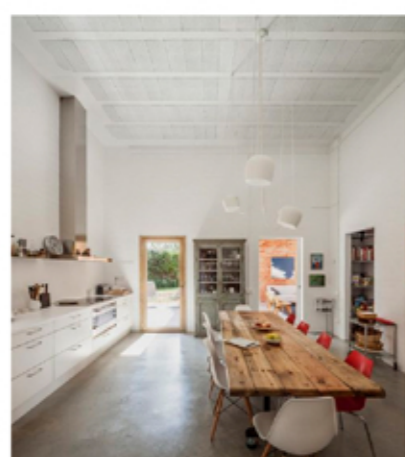
CASA 1101 Harquitectes