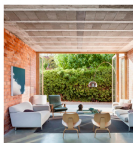
CASA 1101 Harquitectes

Un cop col·locades les biguetes i els revollts, es formigonarà, tenint en compte el pas d'instal·lacions previstos. A més a més, es crearan els dos voladus, per una banda el del passadís d'accés i per la façana sud els balcons.