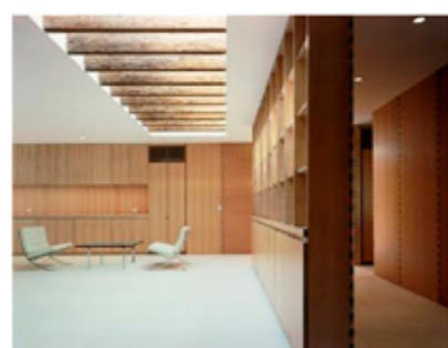
FURNITURE HOUSE Shigeru Ban