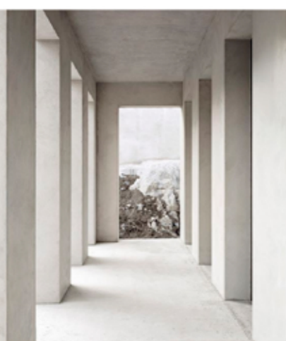
CASA SKURU Hermanson Hiller Lundberg