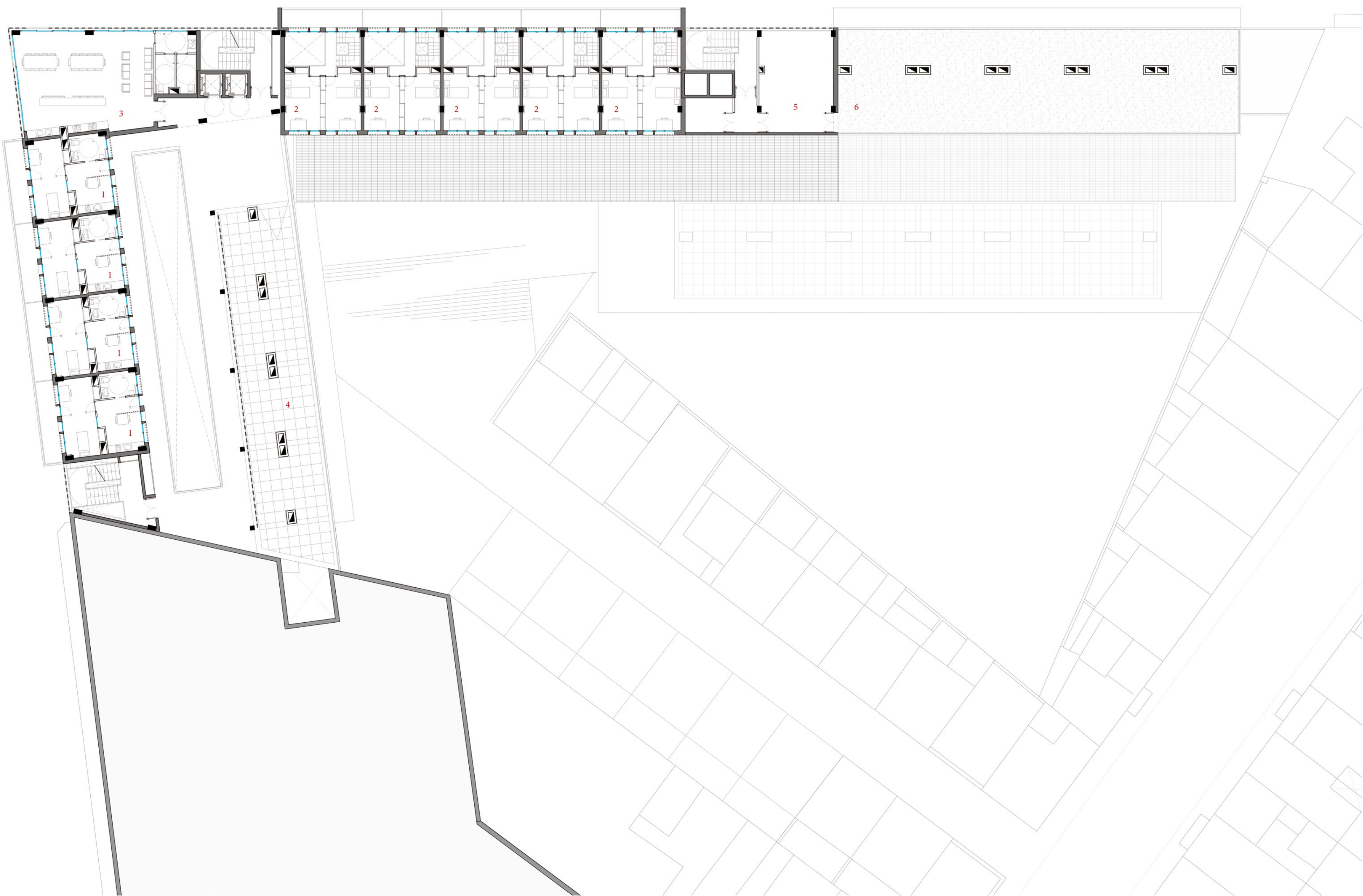
PLANTA SEXTA COTA +47'8 E 1:200