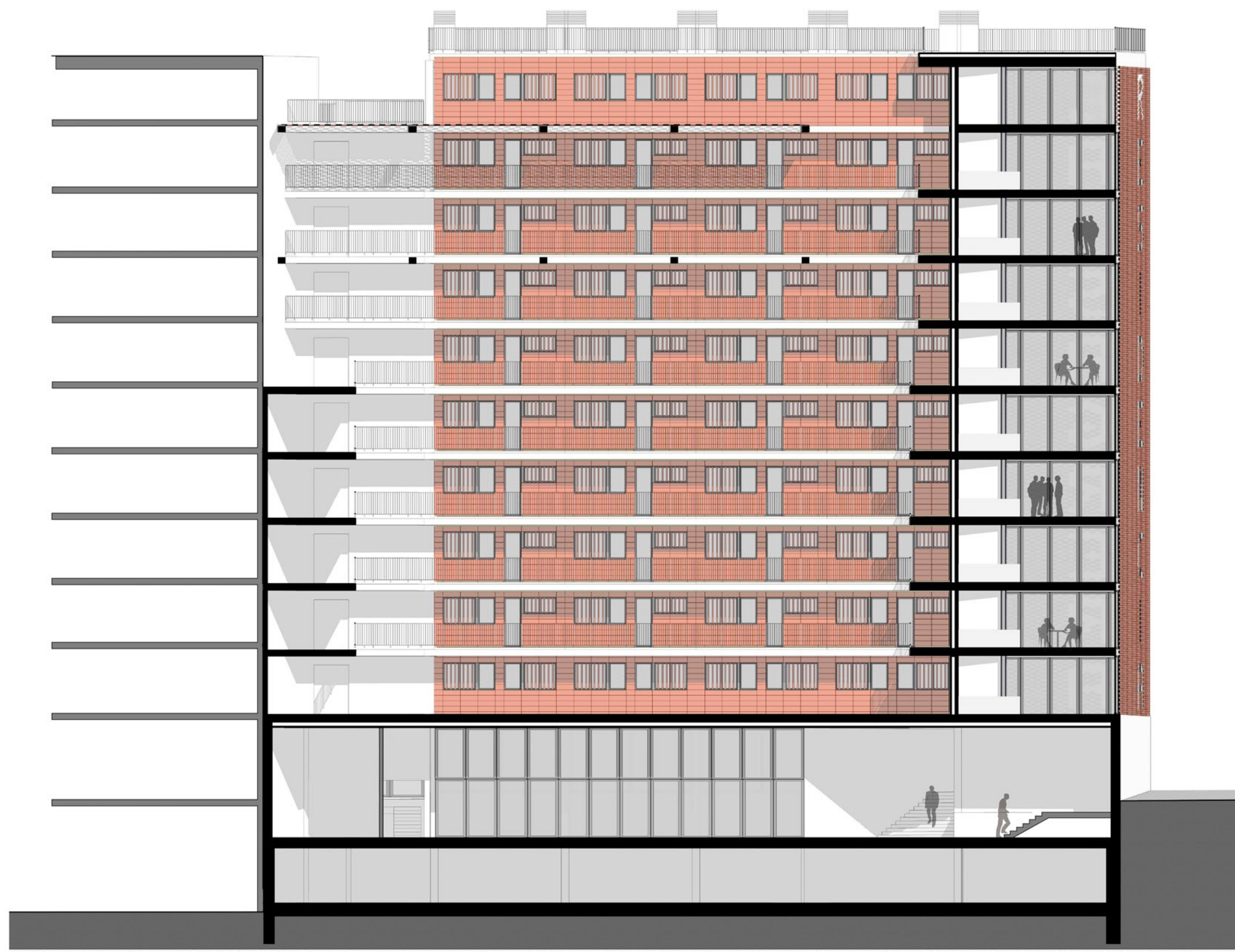
SECCIÓN B E 1:200