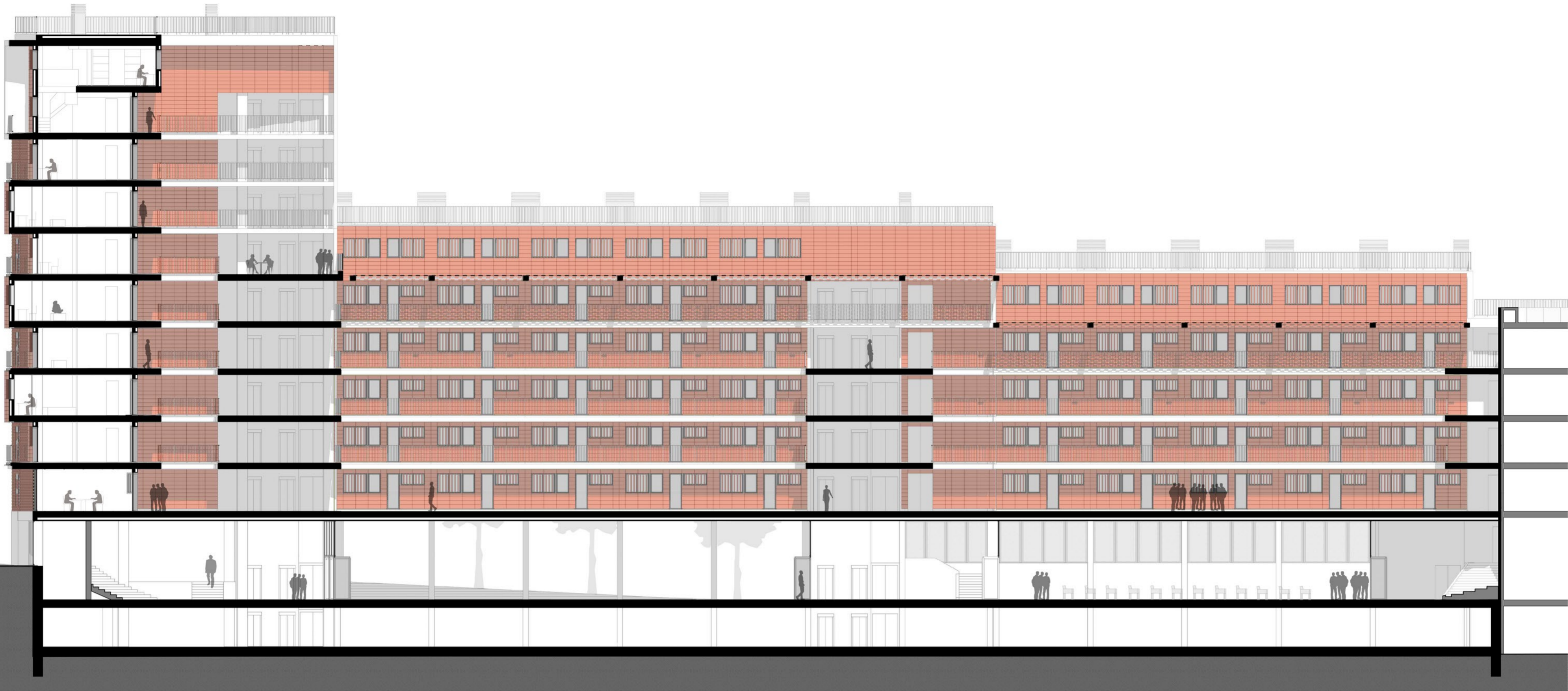
SECCION LONGITUDINAL (SUR) E 1:200