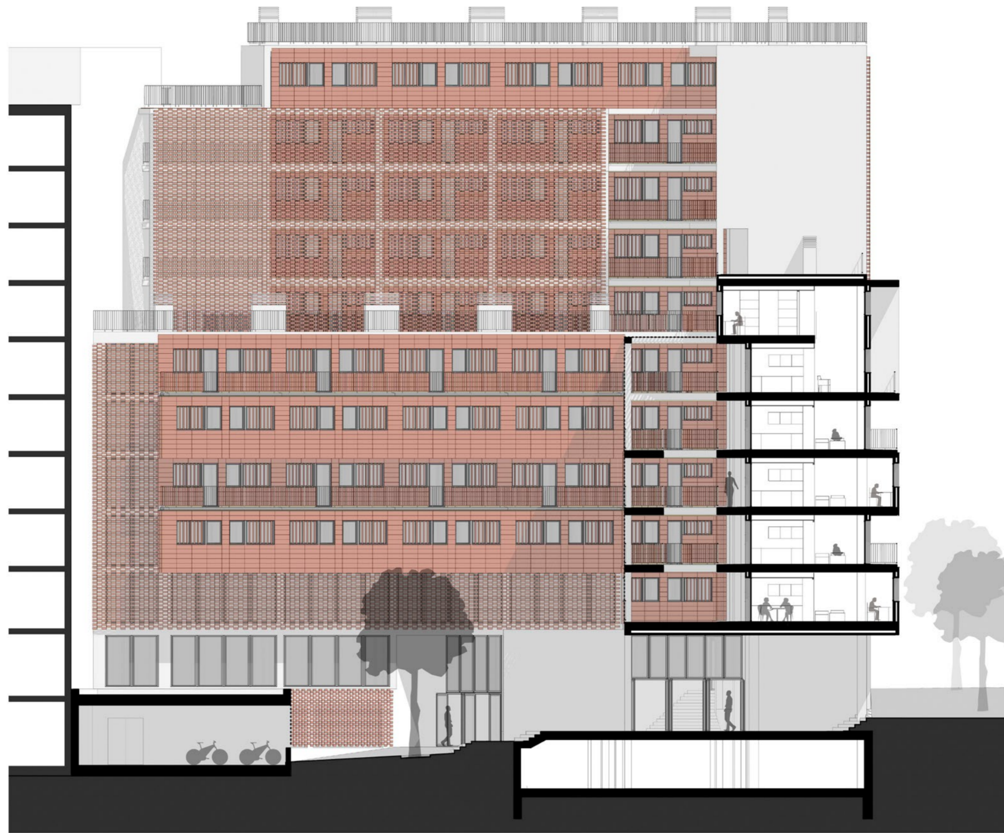
ALZADO ESTE (ALZADO INTERIOR A) E 1:200