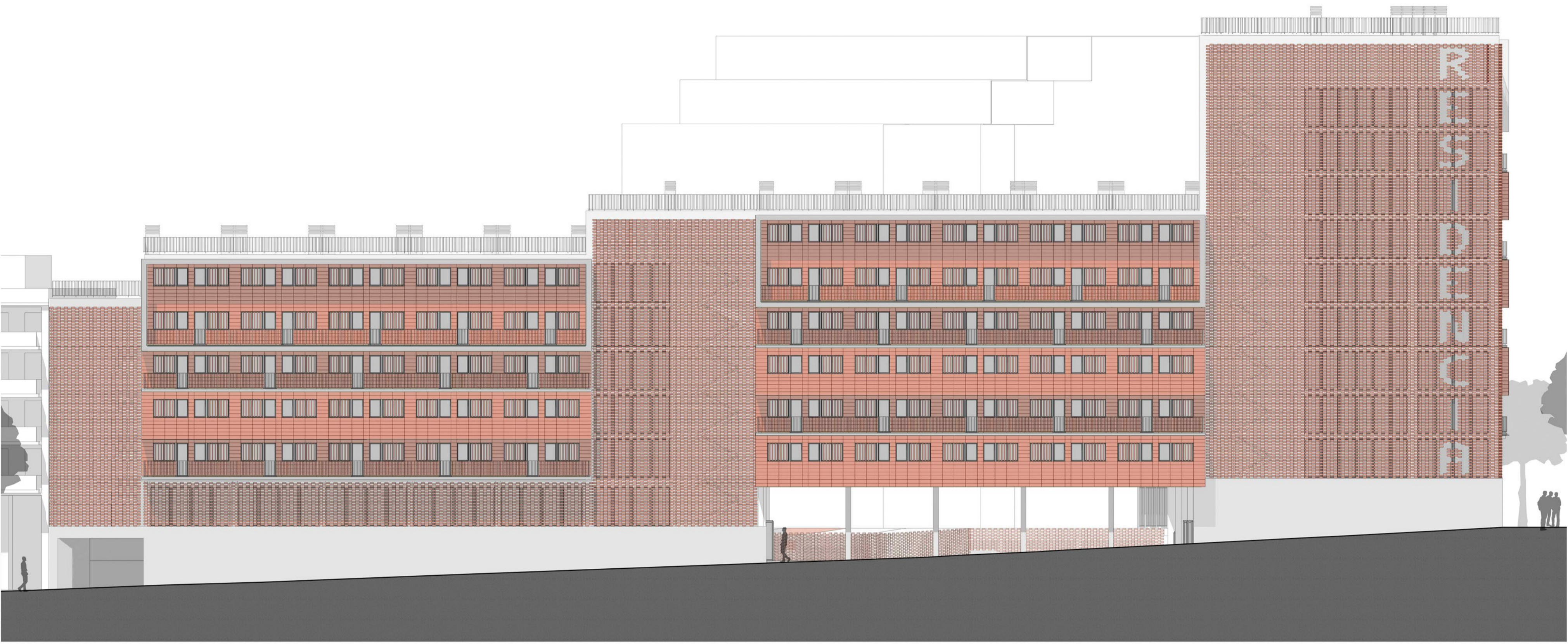
ALZADO NORTE (CARRER GARCILASO) E 1:200