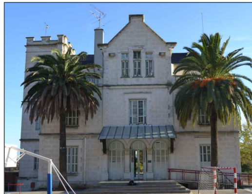
TORRE VIDAL QUADRAS Història i Arquitectura