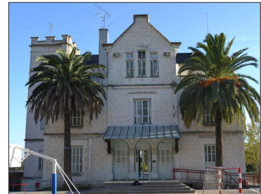
TORRE VIDAL QUADRAS Història i Arquitectura