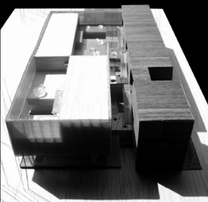
maqueta de madera 45x65cm