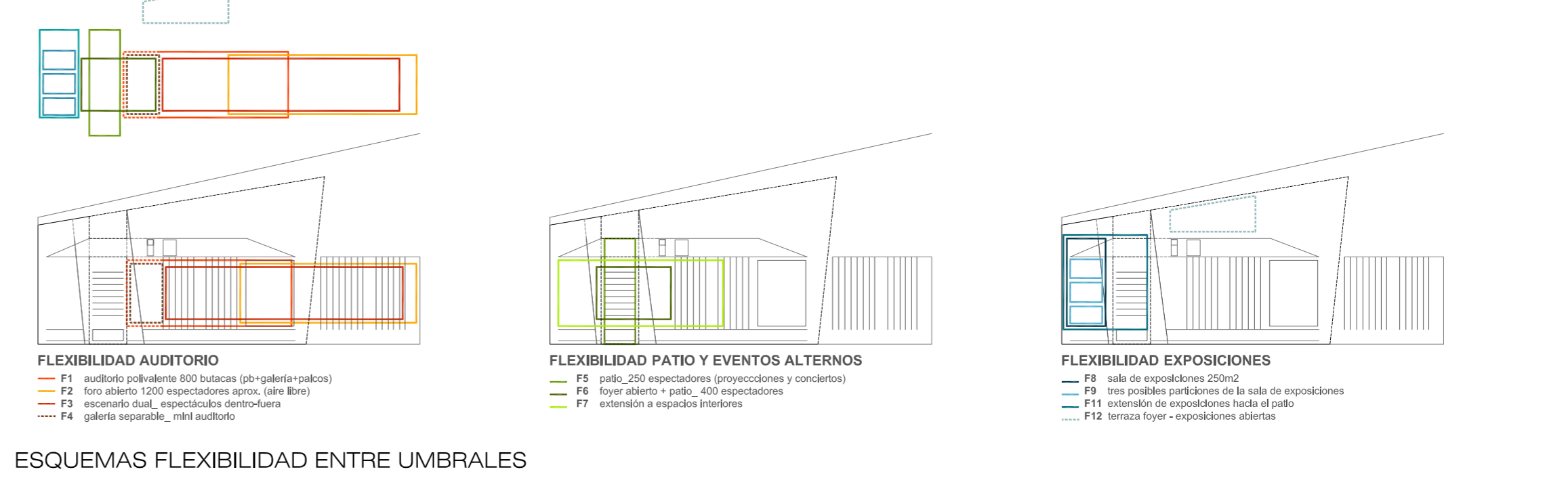
ESQUEMAS FLEXIBILIDAD ENTRE UMBRALES

El auditorio con su presencia y visibilidad desde las carreteras principales acompañará la nueva imagen de entrada a la ciudad. El nuevo edificio, por su emplazamiento, tiene la virtud de organizar y conformar espacios abiertos relacionados con la nueva urbanización.