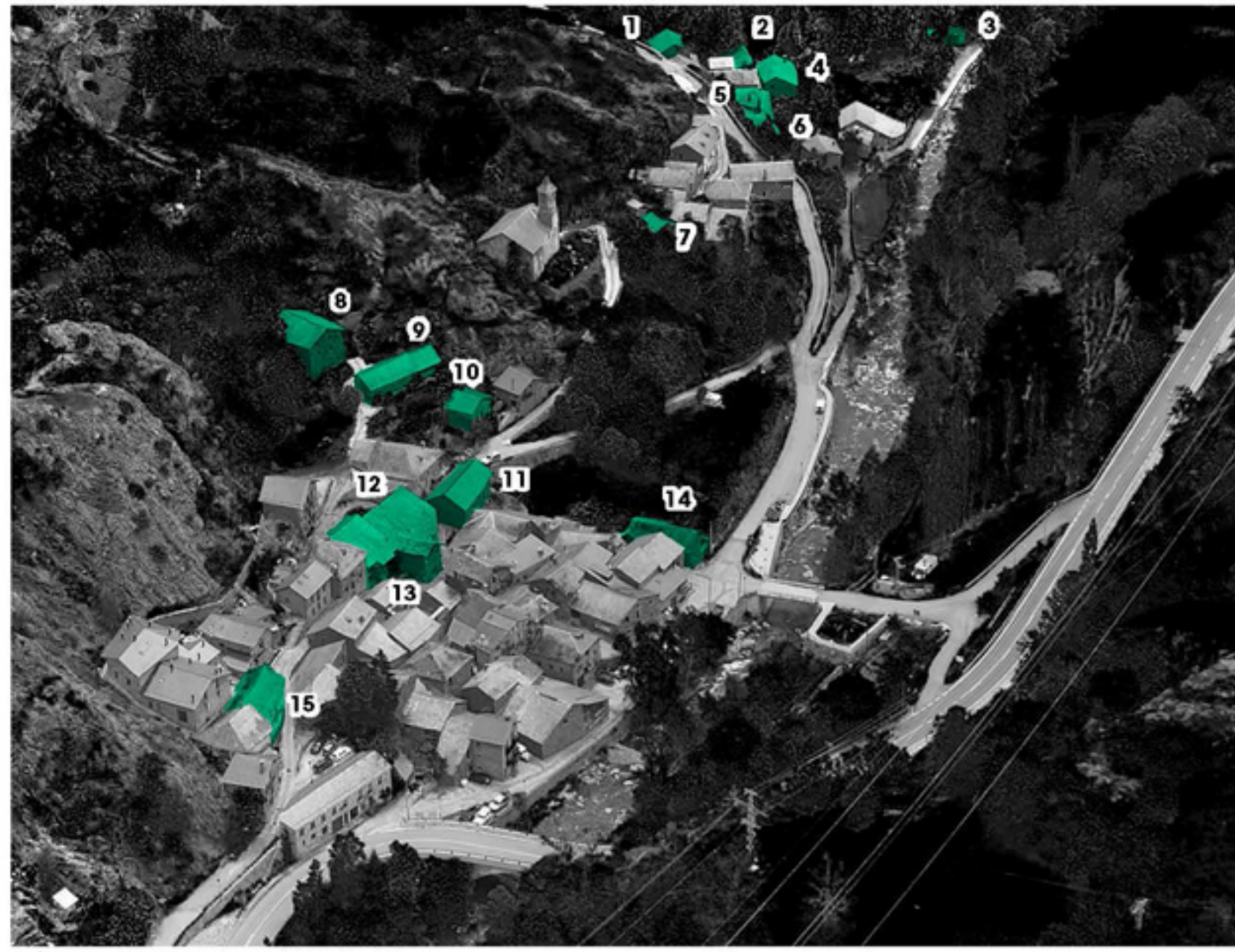
CATÀLEG DE CONSTRUCCIONS OBLIDADES A LLADORRE