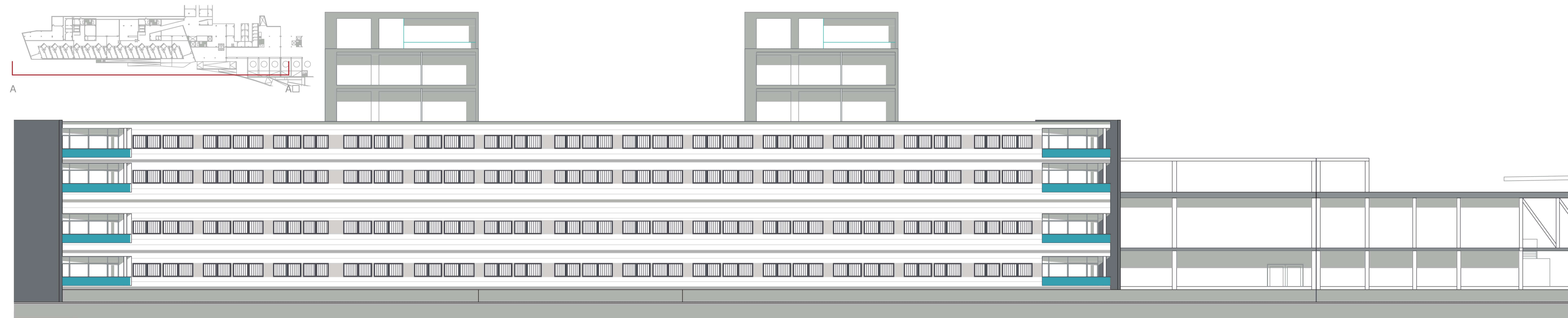
ALÇAT PRINCIPAL A-A