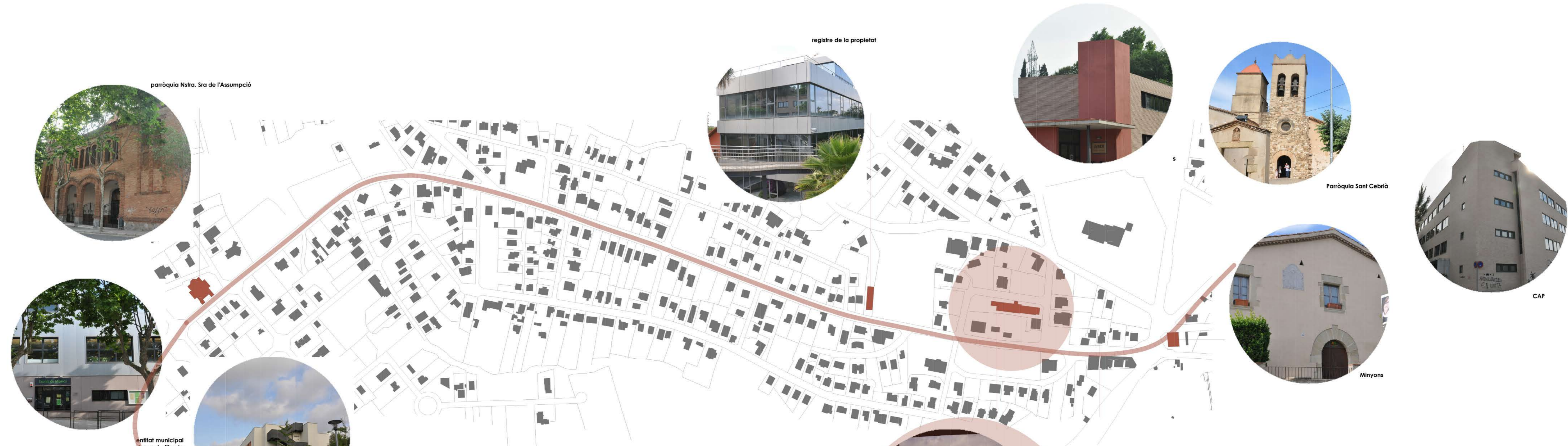
parròquia Nstra. Sra de l'Assumpció