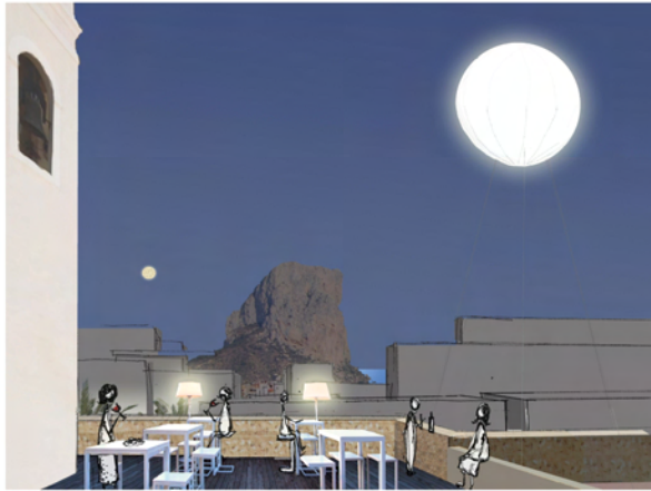
1 Terraza panorámica sobre la muralla, junto a la Iglesia. Se accede a través de un ascensor situado en el edificio municipal de la Plaza del Beato.