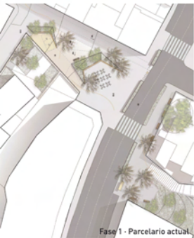
Fase 1 - Parcelario actual