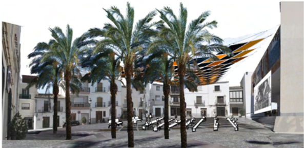
2 Nits a la Fresca Plaça de la Vila