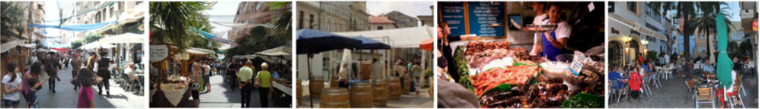
5 Mercado de Productores en la plaza dels Mariners

El MERCADO DE PRODUCTORES consiste en un mercado de productos frescos, con la peculiaridad que el vendedor no es un distribuidor, sino el propio productor. Así, los granjeros venden directamente sus productos, los agricultores los suyos, etc. Esto dota al mercado de un encanto y una garantía de calidad mayor. Nuestra propuesta es crear un mercado de productores partiendo de un comercio que ya existe: la Pescadería de la Cofradía de Pescadores. Una vez a la semana, se podrían habilitar en los alrededores de la Plaça dels Mariners y calle del Mar unos puestos de venta ambulante donde se ofrecerían productos autóctonos directamente por los productores. Dada la estructura productiva de la zona, sería recomendable la presencia de cooperativas agrícolas de la zona que pueden vender sus productos (nísperos de Callosa, cerezas de la Montaña de Alicante, mistela de Xaló, etc) así como pequeñas bodegas, licorerías, etc. Cabe la posibilidad de que en los locales de hostelería próximos cocinen el producto recién comprado (en especial el marisco).