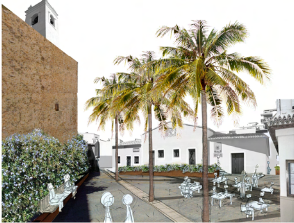
3 Oficina del Casco Antiguo Plaza del Beato