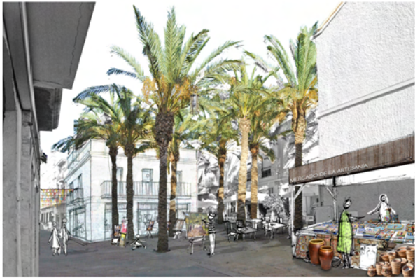
4 Mercado de artesanía Plaza de España