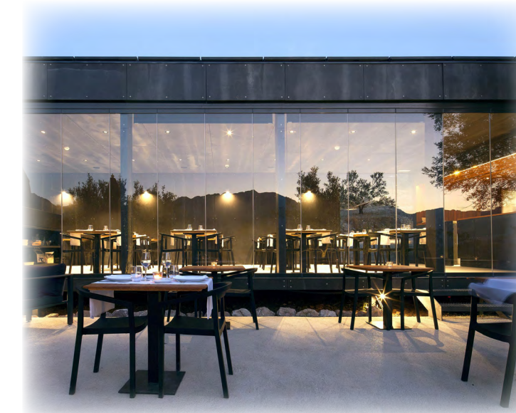
BAR/RESTAURANTE REFERENCIA TEYCO

"Se trata de un trapezoide de color blanco, con el costado más largo como plano inclinado de cubierta, y uno de los catetos como límite de la caja escénica, que se abre al exterior a través del único gran recorte del plano de fachada, cerrado por una puerta de 20 metros de color rojo que conecta interior y exterior, lo que permite gozar de representaciones y conciertos al aire libre"