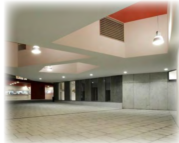
TEATRO ATLANTIDA - JOSEP LLINÀS

"El interior del edificio presenta unos acabados cromáticos que contrastan entre sí, los robustos tonos claros con la elegancia de los tonos oscuros"