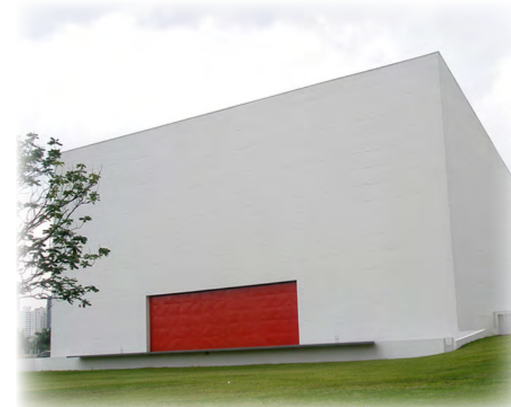
IBIRAPUERA AUDITORIUM, SÃO PAULO, OSCAR NIEMEYER

"Se abre el falso techo en puntos determinados del proyecto con la intención de enfatizarlos. Se cuelgan las luminarias para enfatizar más este concepto"