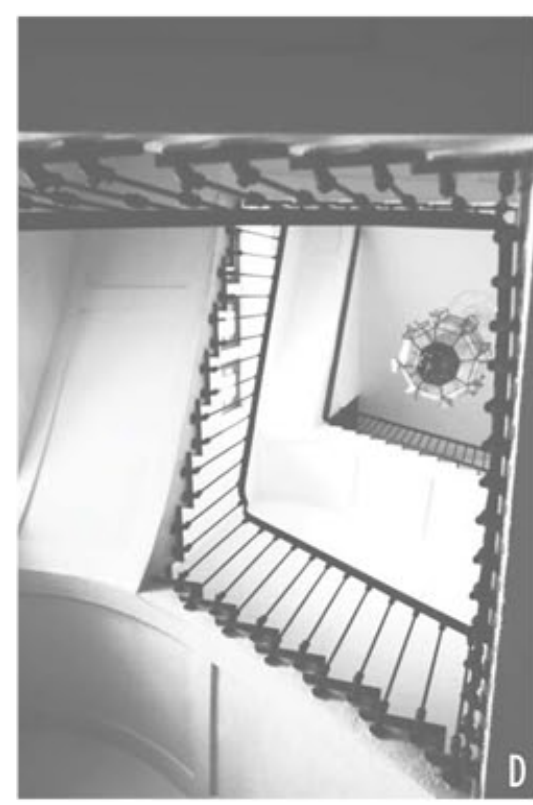
ELEMENTS PATRIMONIALS PROTEGITS