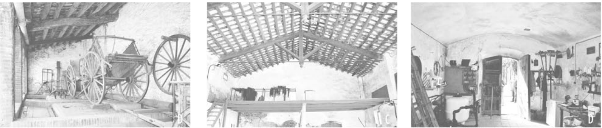
IMATGES ESPAIS INTERIORS

Tant la masia com alguns dels seus elements estaran escollits com a patrimoni arquitectònic i catalogats com a Bé d'Interès Local des del 2007. Aquest factor també ens afecta en el moment de proposar una intervenció realitzada, és per això que també es té en compte.