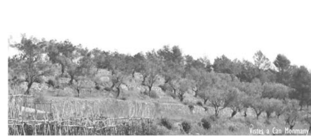
Fotes a Can Monmany