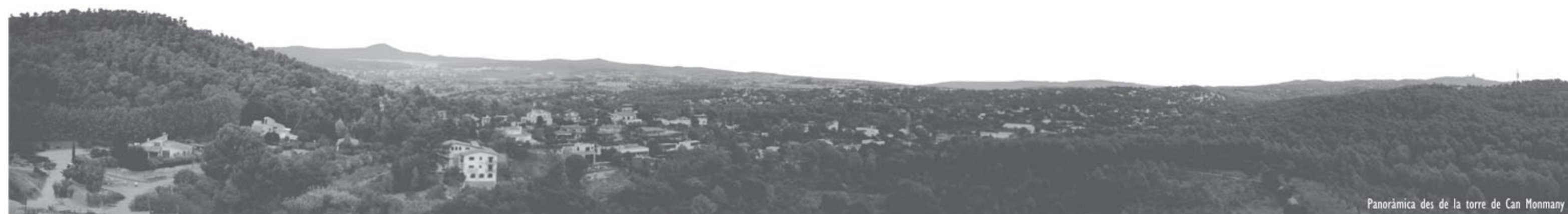
Panoràmica des de la torre de Can Monmany

PLÀNOL SITUACIÓ escala 1/5.000 IRIS RODRIGUEZ FACERIAS PFC/ ETSAB/ UPC/ OCTUBRE 2016