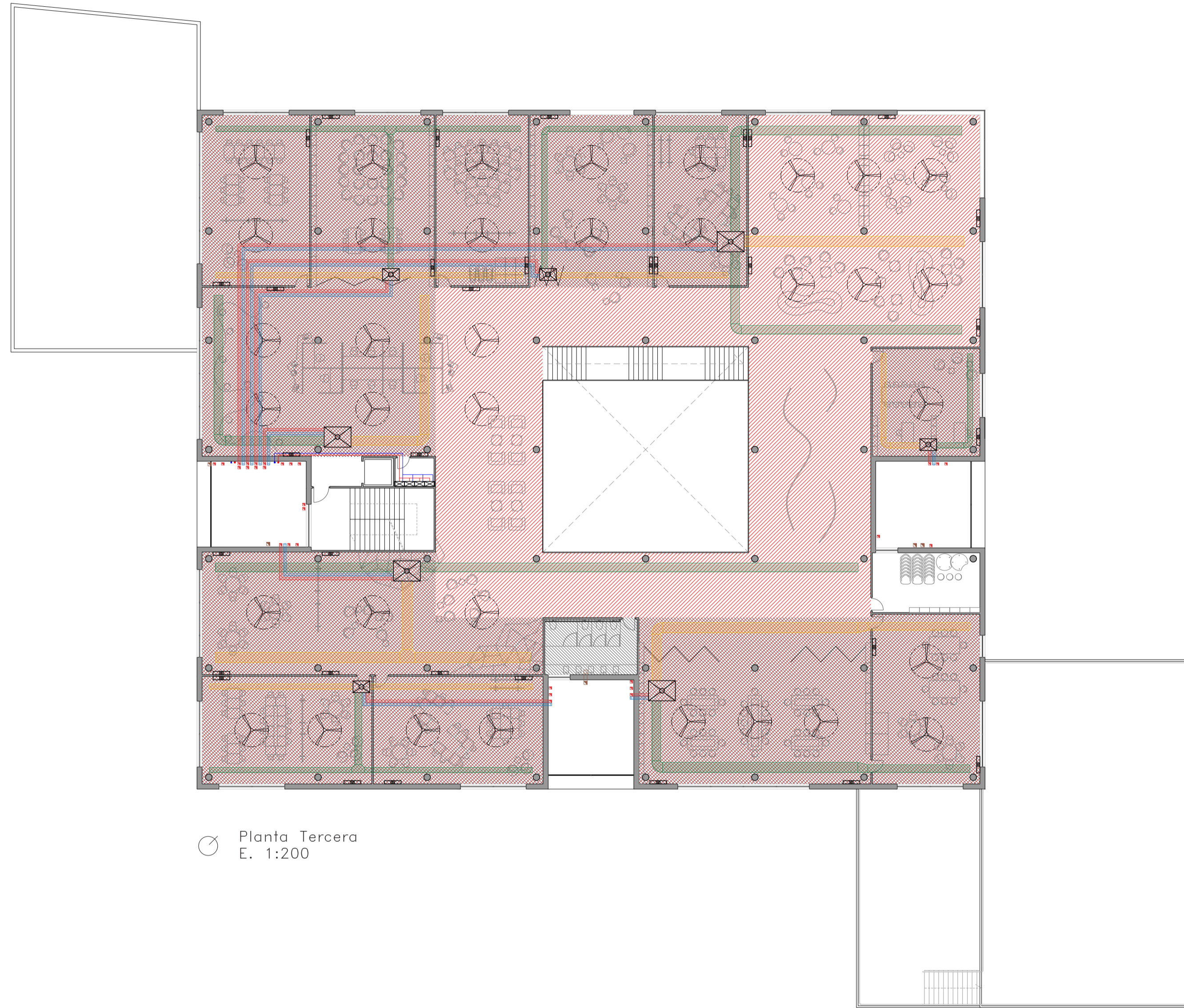
Planta Tercera E. 1:200