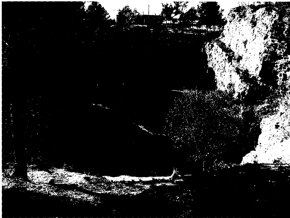
Aspecte d'una de les explotacions abandonades, ara convertida en un espai humit

A les antigues guixeres , a l'igual que en molts indrets del terme municipal de Vilobí del Penedès, es troben uns afloraments de nivells evaporítics, els quals es troben constituïts per alternances de guixos i d'argiles. Entre els primers, que són els que predominen, es troben bones mostres de GUIX (primari de caràcter massiu, i secundari, d'aspecte laminar o fibrós, segons els indrets). També es troben mostres d'ANHIDRITA (molt minoritària) i de SOFRE (molt ocasionalment).