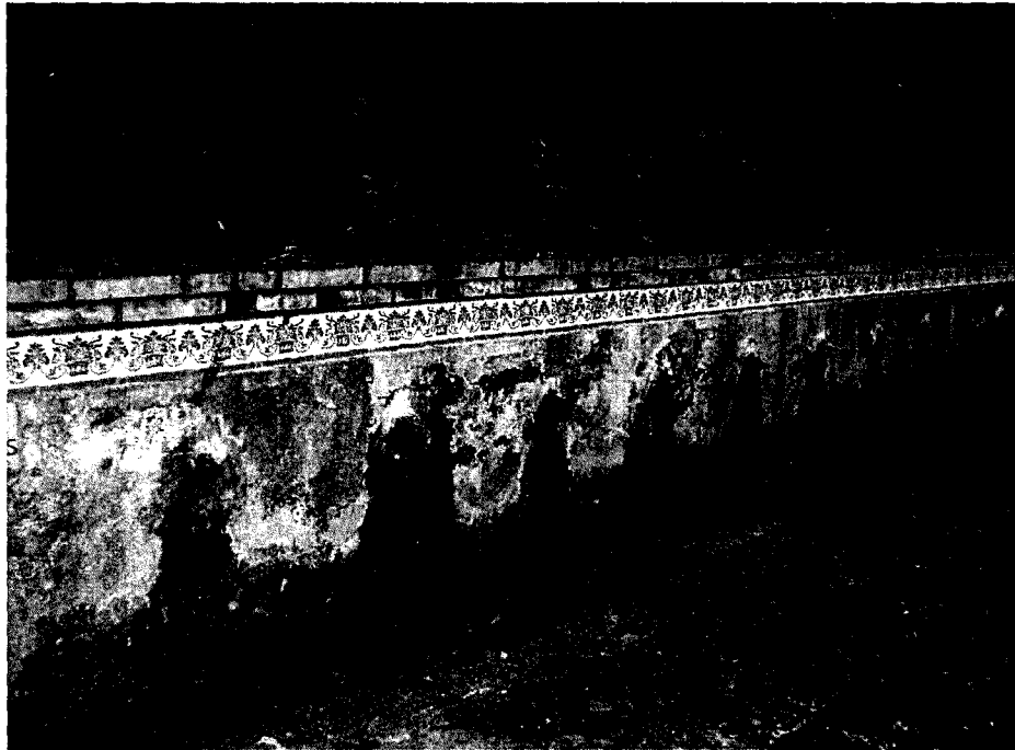
Us aspecte de les fonts (ara seques)

Per d'altra banda, en aquest lloc hi ha unes dous , en les quals hi mena l'aigua, com a conseqüència de la falla anteriorment esmentada.