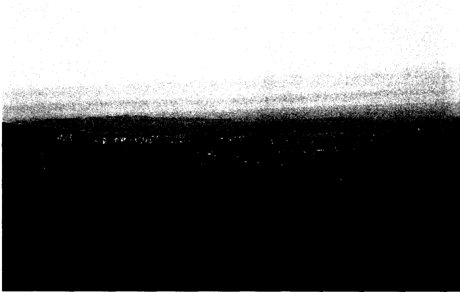
Des de Can Polinyà, en primer terme els relleus de Foix (Serralada prelitoral) i darrera la Depressió Prelitoral. Molt al fons i difósa, la Serralada Litoral

En arribar a aquest indret, podem fer una nova aturada. Així, des d'aquí, mirant cap al Sud, es pot veure una bona perspectiva del Sistema Mediterrani. Així, es pot veure la Serralada Prelitoral , on ara som. La Depressió Prelitoral Catalana , més al Sud; i de la Serralada Litoral .