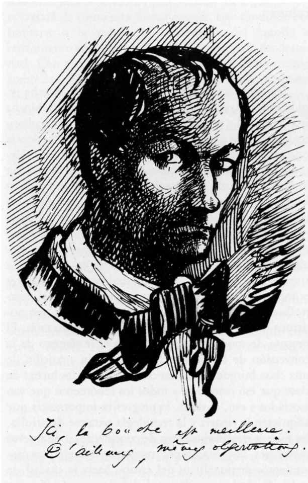
Charles Baudelaire. Autoretrato.

riencia histórica de los hombres y mujeres que viven en ese mundo en el que, como decía Marx, todo lo que es estable se disuelve en el aire continuamente, todo lo que es estamental se disuelve y es sustituido por otra cosa: nuestro mundo ya es completamente distinto del que vivimos en nuestra infancia y el que viviremos cuando seamos viejos será completamente distinto del presente. La experiencia de vivir en este mundo es lo que podemos llamar modernidad. Ser «moderno» es tener consciencia de esa experiencia de la modernidad, ser consciente de vivir en este mundo en el que todo es un torbellino que está cambiando, en el que todo se está modificando: las normas sociales se modifican, las ciudades se transforman, las relaciones entre los hombres cambian, aparecen siempre cosas nuevas; estamos arrojados a un mundo en el que todo se transforma, todo lo nuevo se convierte en viejo en seguida en un proceso infinito, continuo, inacabable.