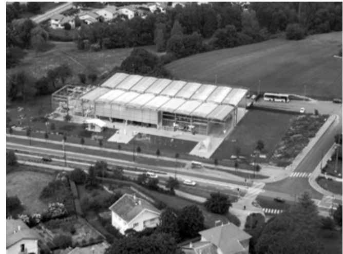
vista general Grands Ateliers

Els Grands Ateliers de França són el referent arquitectònic per excel·lència per a aquest tipus de programa. El seu estudi ha estat imprescindible per al desenvolupament del projecte.