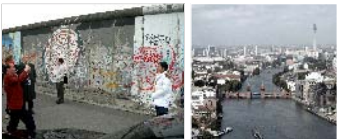
East side gallery... Fragmento del muro de 1.3 km de longitud, en la orilla del río Spree.