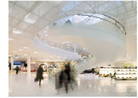
Dos escaleras de caracol abiertas conectan los niveles de la mediateca