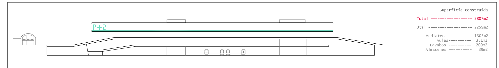
P+2 / mediateca [cota 17,50]