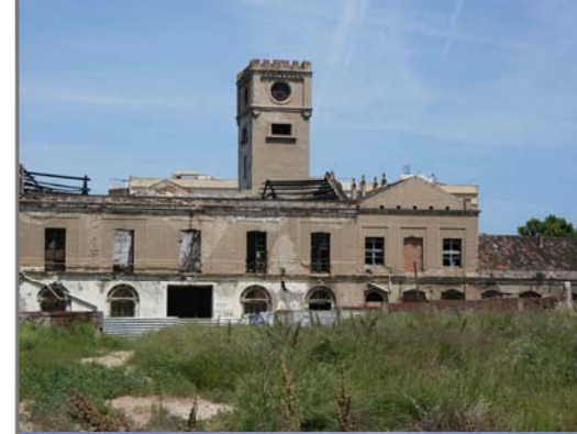
Museu de Lleida: Joan Rodon