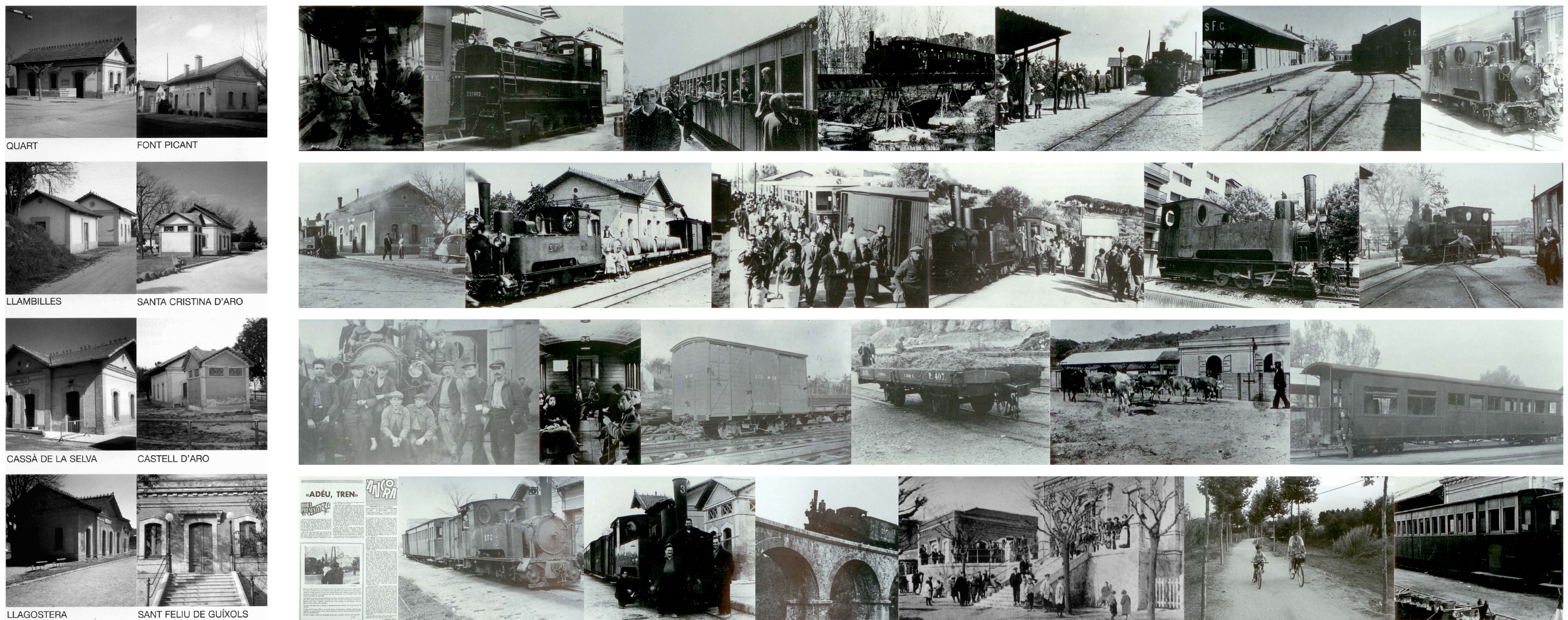
QUART, FONT PICANT, LLAMBILLES, SANTA CRISTINA D'ARO, CASSÀ DE LA SELVA, CASTELL D'ARO, LLAGOSTERA, SANT FELIU DE GUÍXOLS