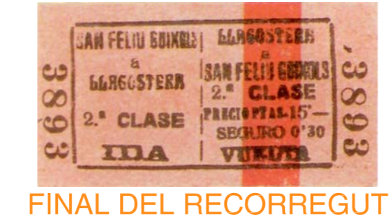
FINAL DEL RECORREGUT