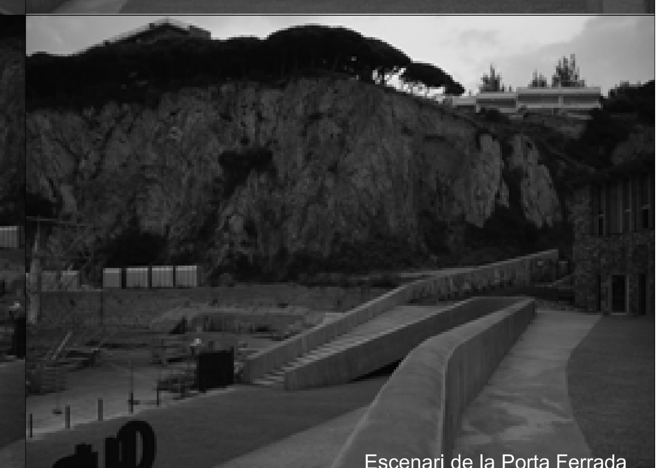
Escenari de la Porta Ferrada