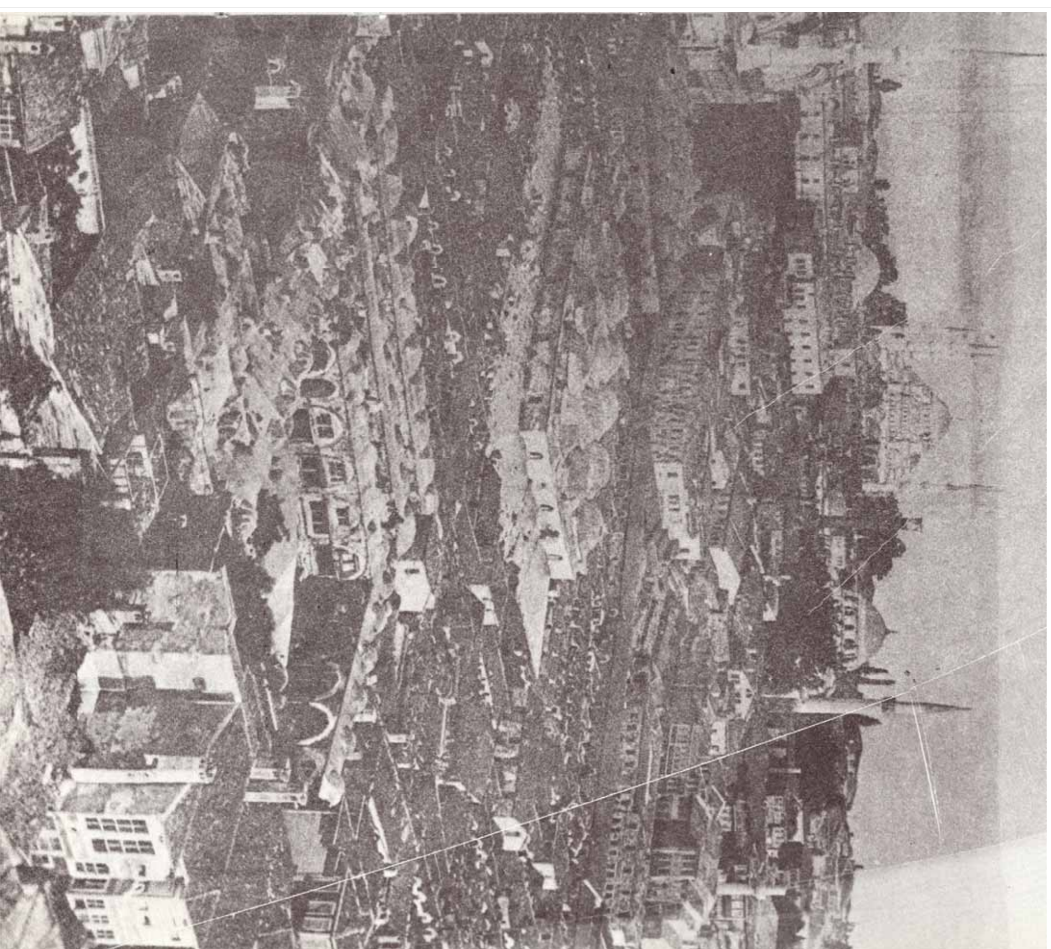
Cebeci Han · Imatge d'arxius de 1940