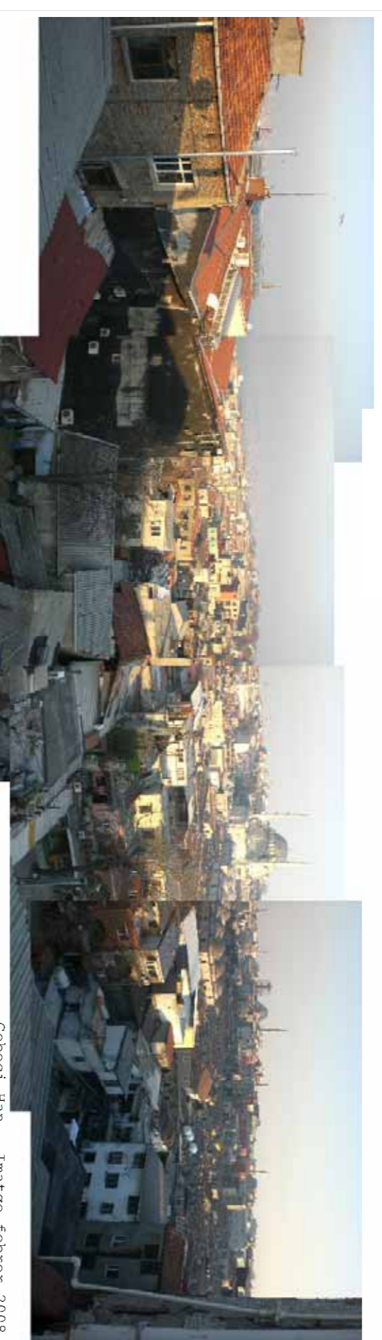
Cebeci Han · Imatge febrer 2018.

L'operació urbanística, només 100 anys després de la construcció del Cebeci Han, ja no es considerava aquest bloc de edifici a part i permetia a través d'una nova (re)construcció i per la ciutat del desenvolupament.