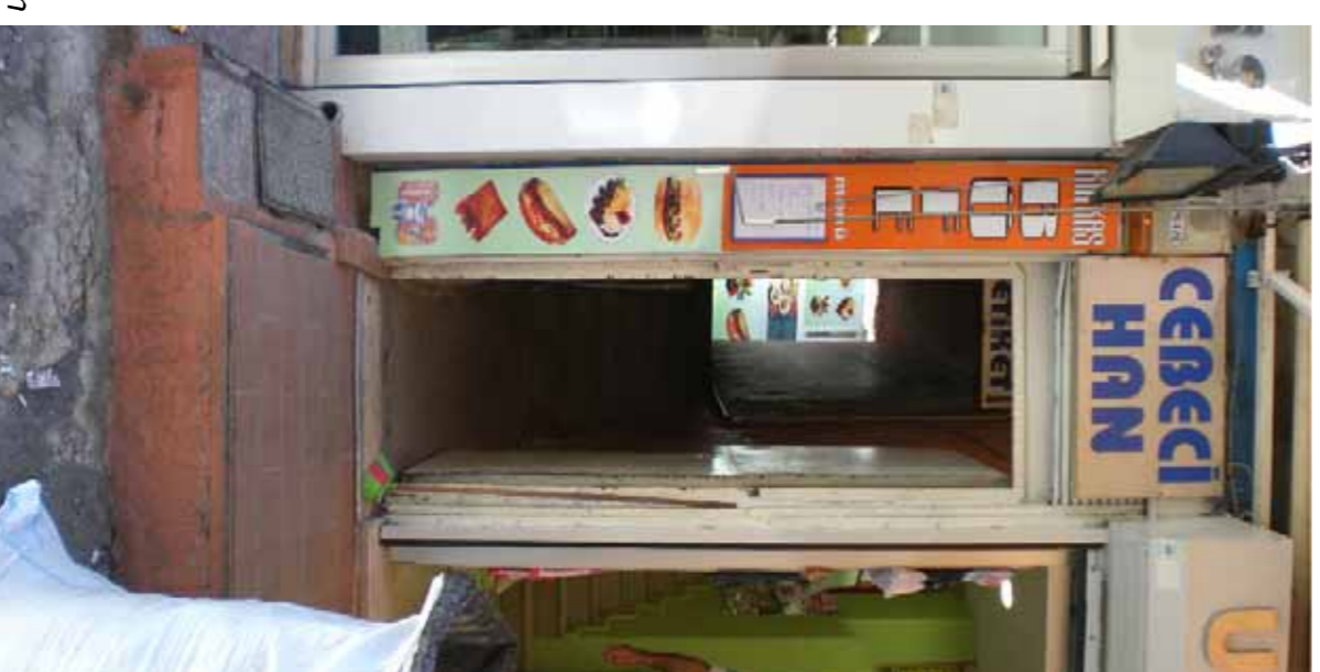
>Un accés ocult al Cebeci Han