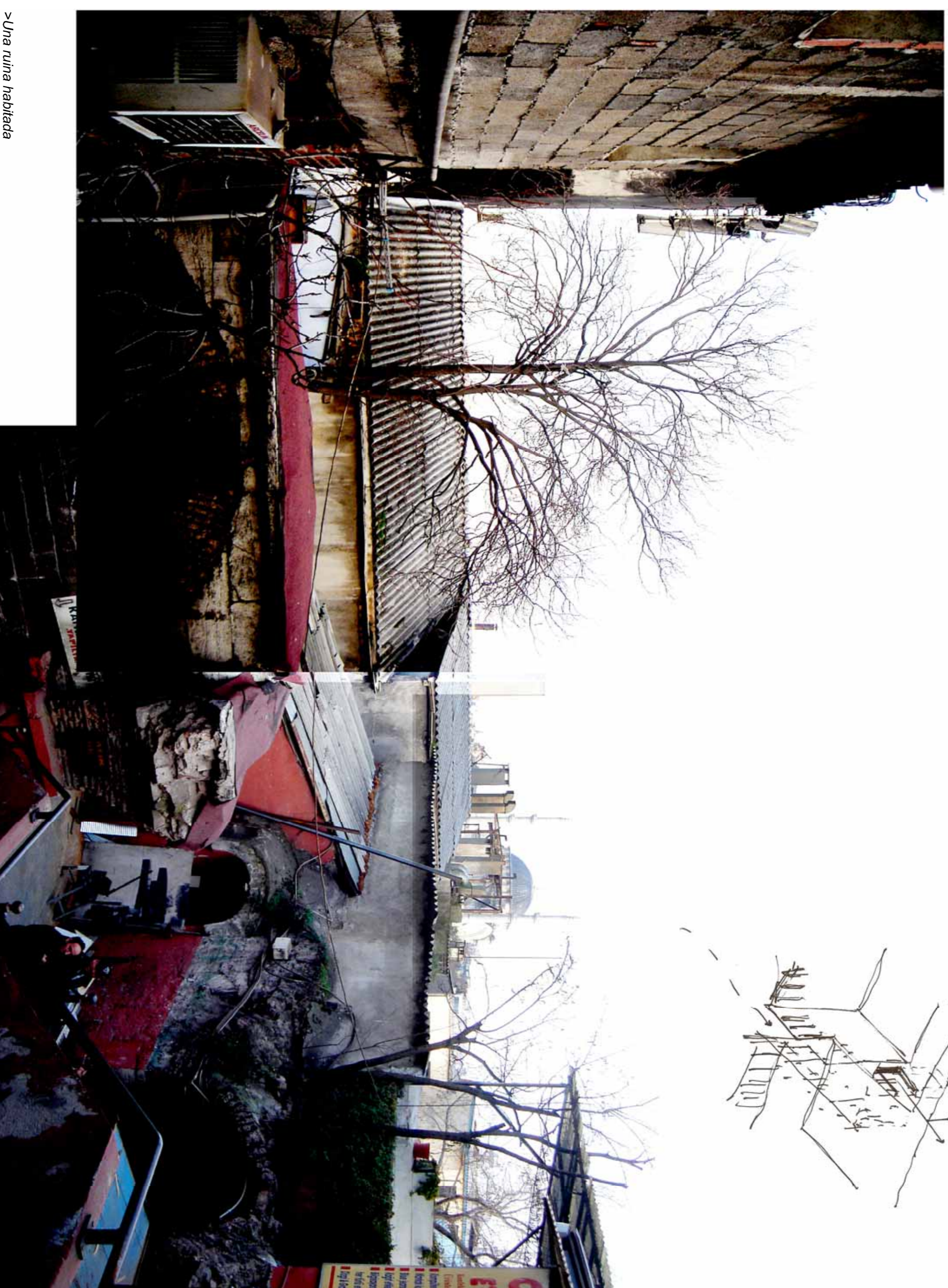
>Una ruïna hablada