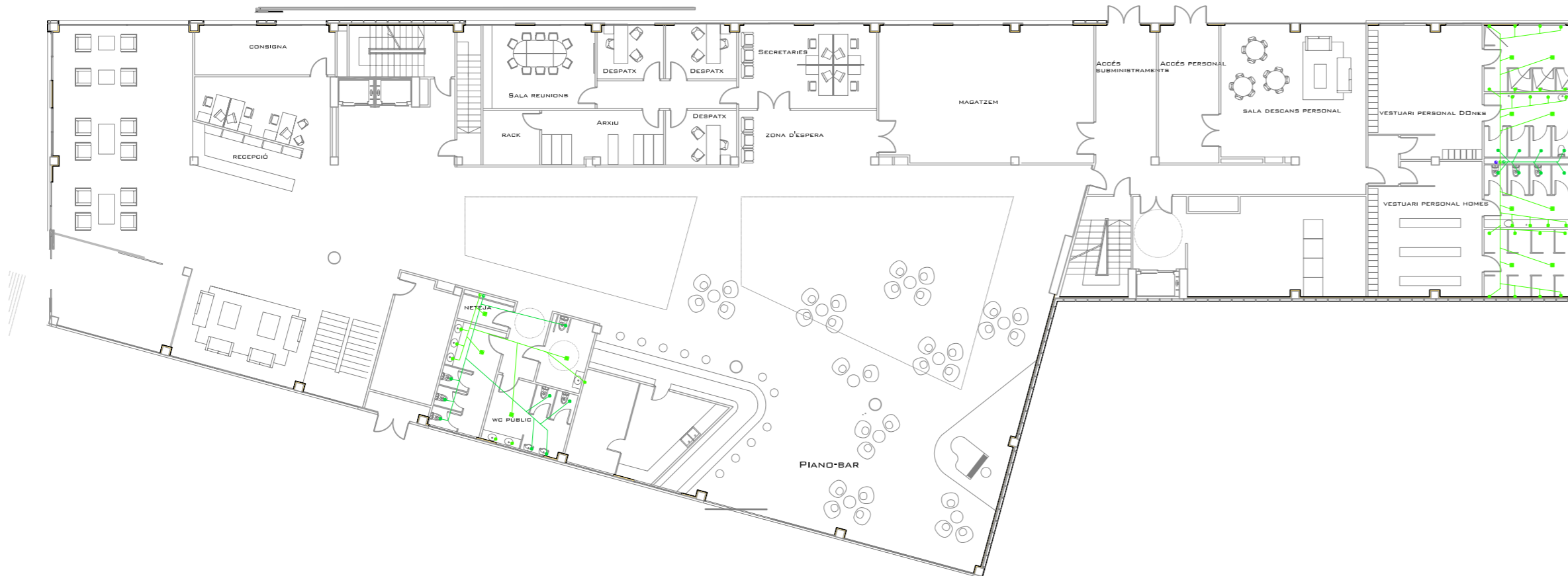
PLANTA BAIXA E:1/250