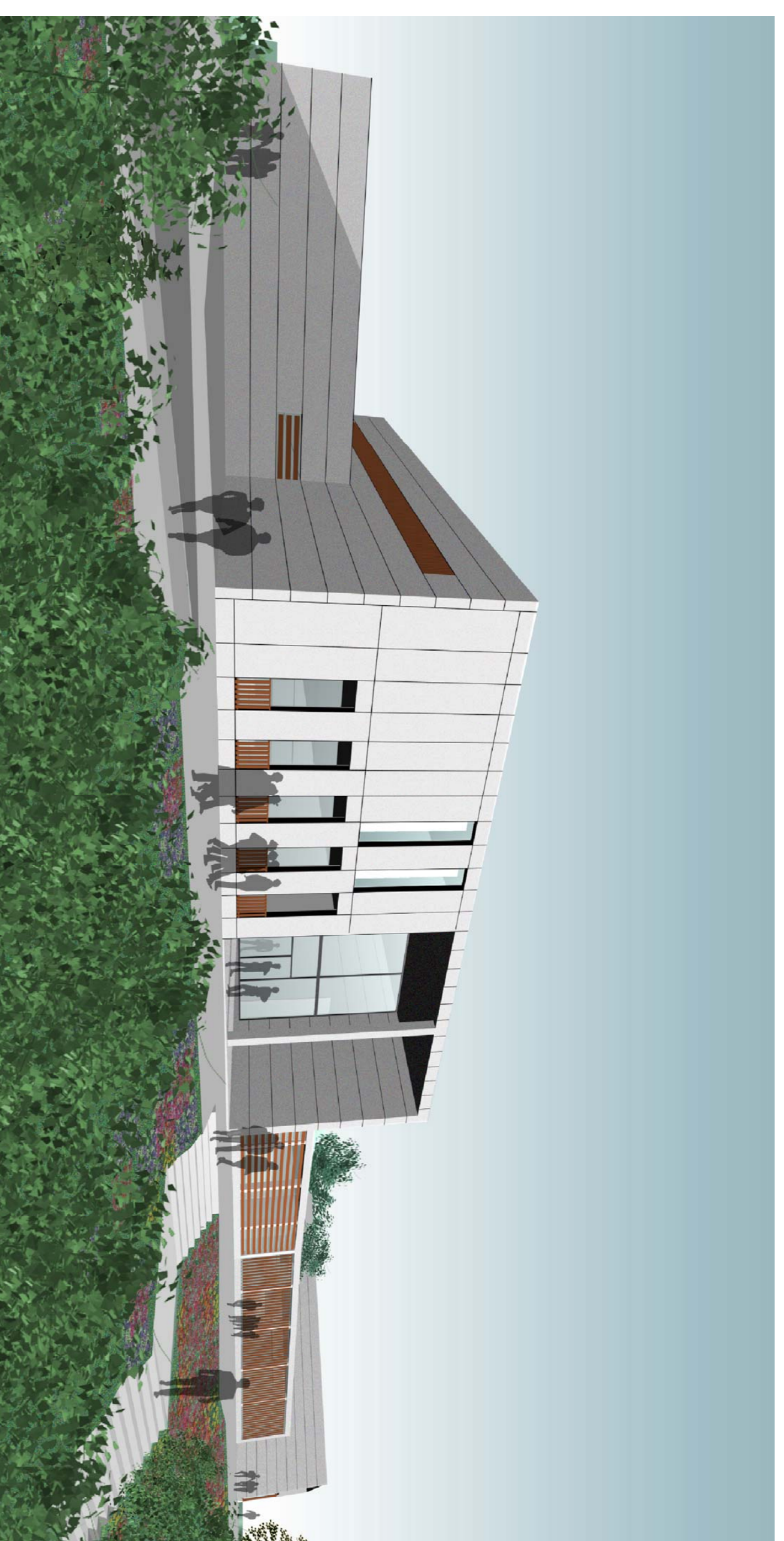
VISTA EXTERIOR DE LA ZONA D'ENTRADA