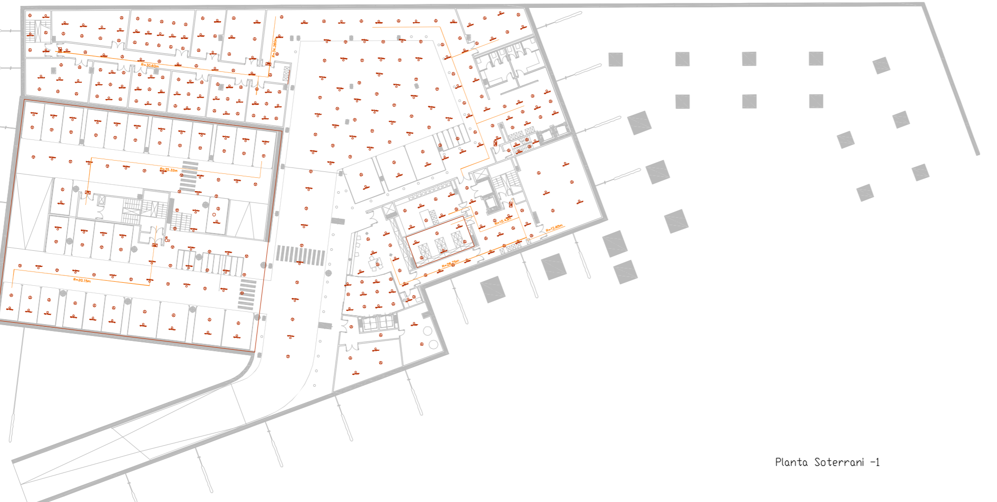
Planta Soterrani -1