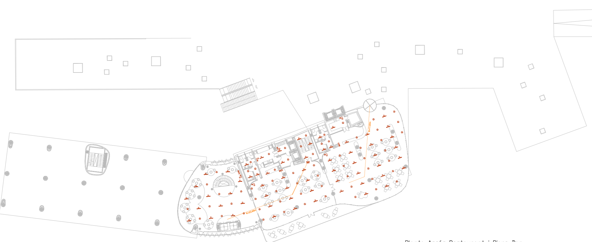
Planta Accés Restaurant i Piano-Bar