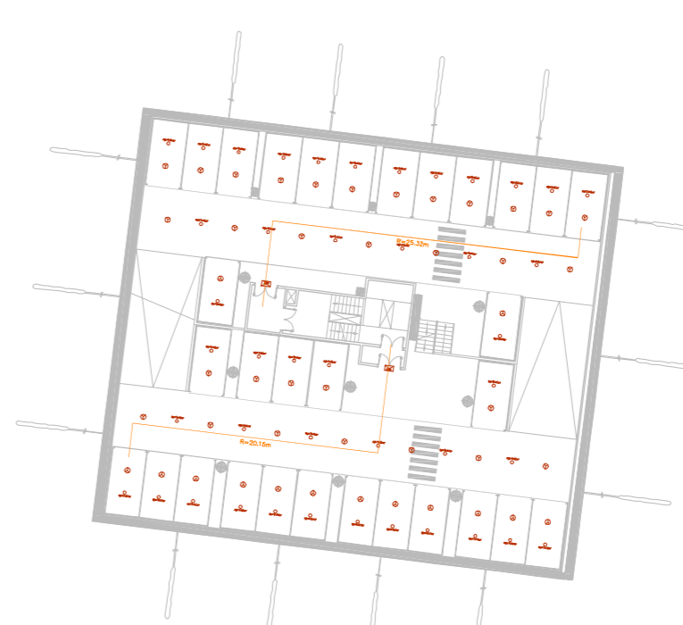
Planta Soterrani -2 i -3