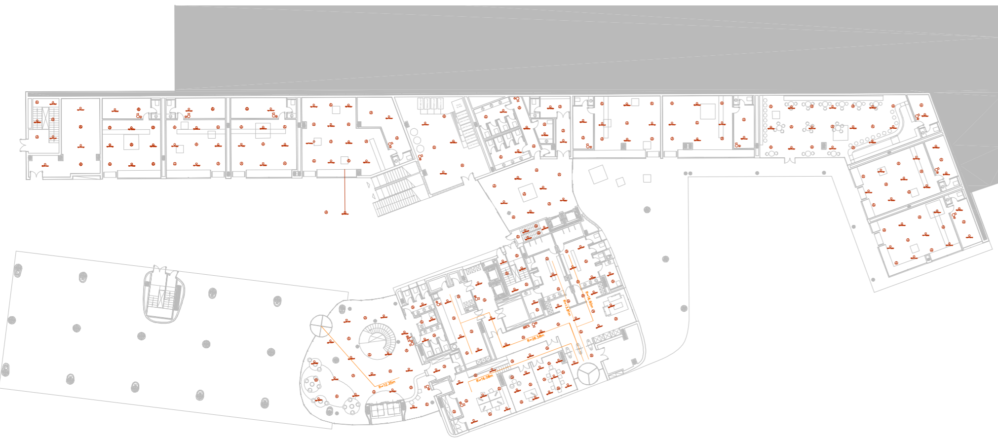
Planta Accés Hotel