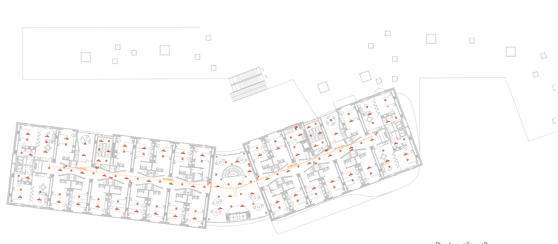
Plantas +3 a +9