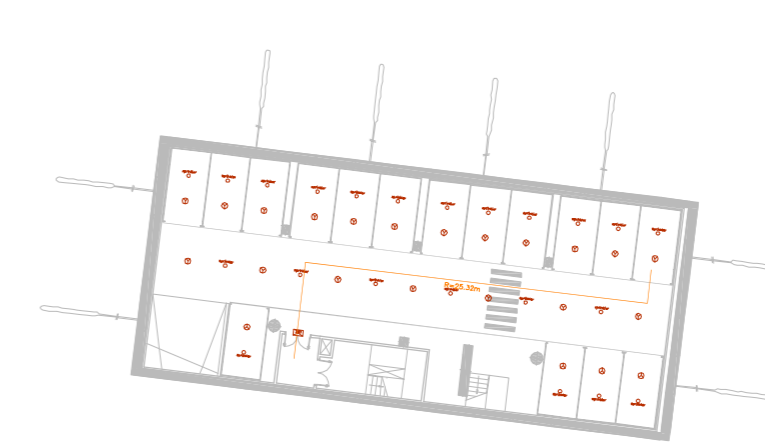
Planta Soterrani -4