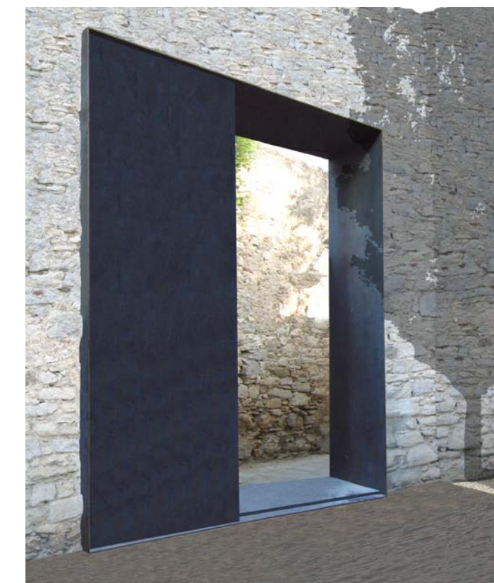
REF. 1_ FOTOMUNTATGE PORTA ENTRADA des del c/ PORTAL NOU (vista des de dins del pati_ porta corredissa)