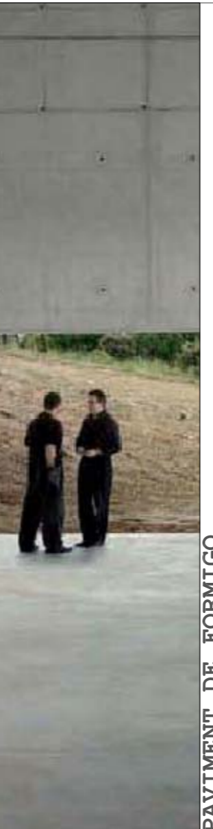
PAVIMENT DE FORMIGÓ