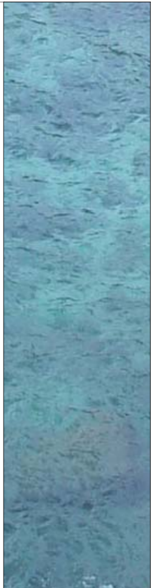
AIGUA DE MAR