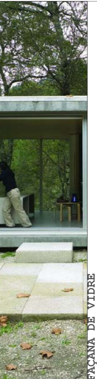
FAÇANA DE VIDRE