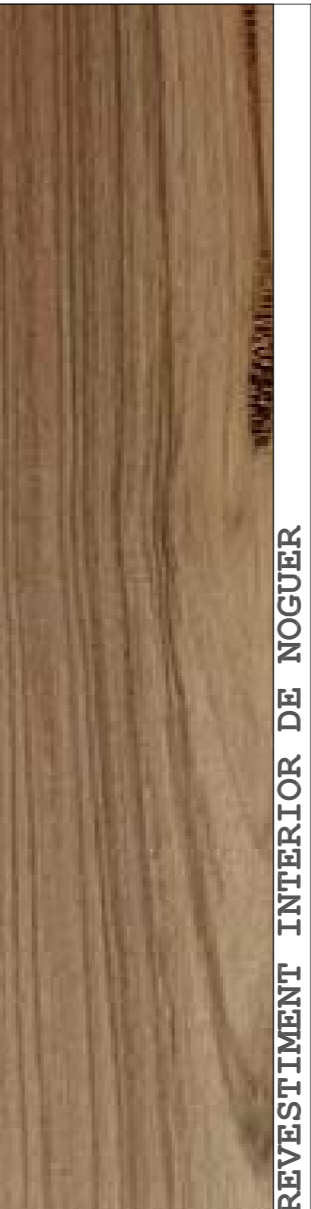
REVESTIMENT INTERIOR DE NOGUER