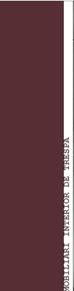
MOBILIARI INTERIOR DE TRESFA