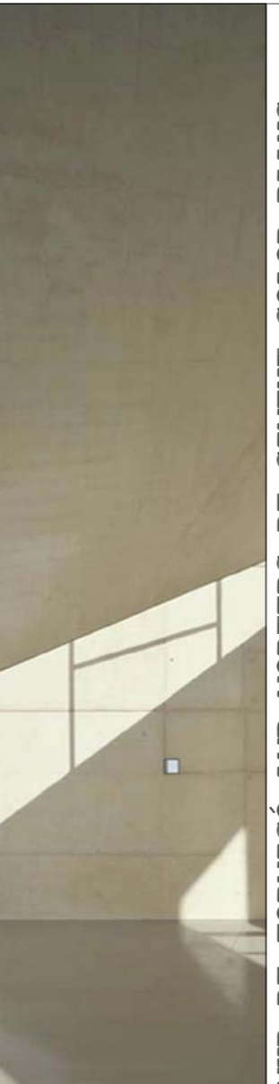
MUR DE FORMIGÓ AMB MORTERS DE CIMENT COLOR BLANC