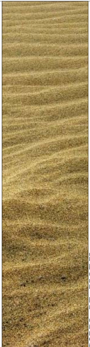
SORRA DE PLATJA

Als vestuaris, la part més obscura i humida, es fa ús de vidres translúcids que permeten el pas de la llum i deixen entreveure siluetes, pero només si son molt aprop. Hi han algunes zones on el programa requereix uns materials resistents a la activitat que es desenvoluparà, per exemple, la cuina, per a la qual s'ha escollit acer inoxidable per tots els acabats.