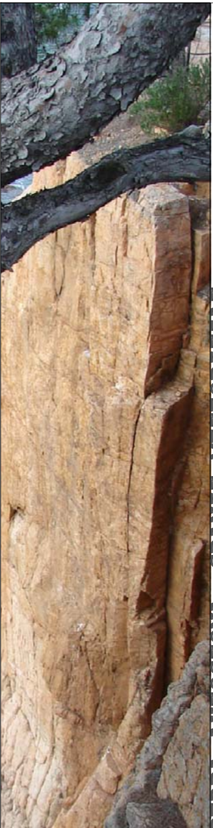
PEDRA AUTOCTONA -GRANIT METEORITZA'