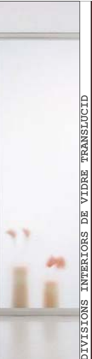
DIVISIONS INTERIORS DE VIDRE TRANSLÚCID