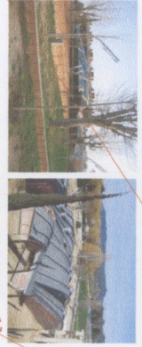
Arquitecte: Arata Isozaki, Any de construcció: 1987