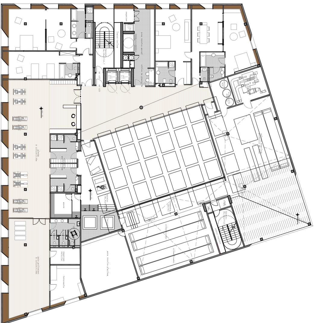
PLANTA NOVENA +186.00