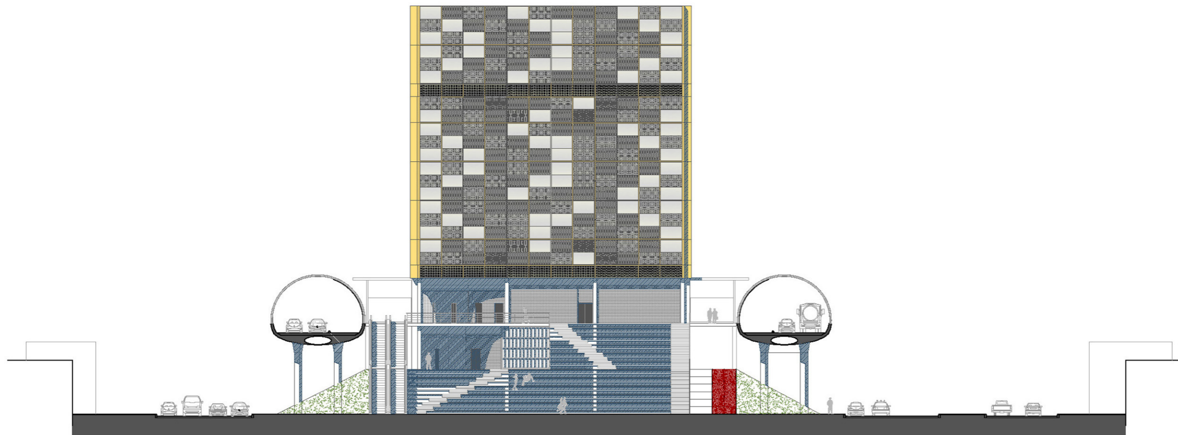
alzado NE esc. 1:200