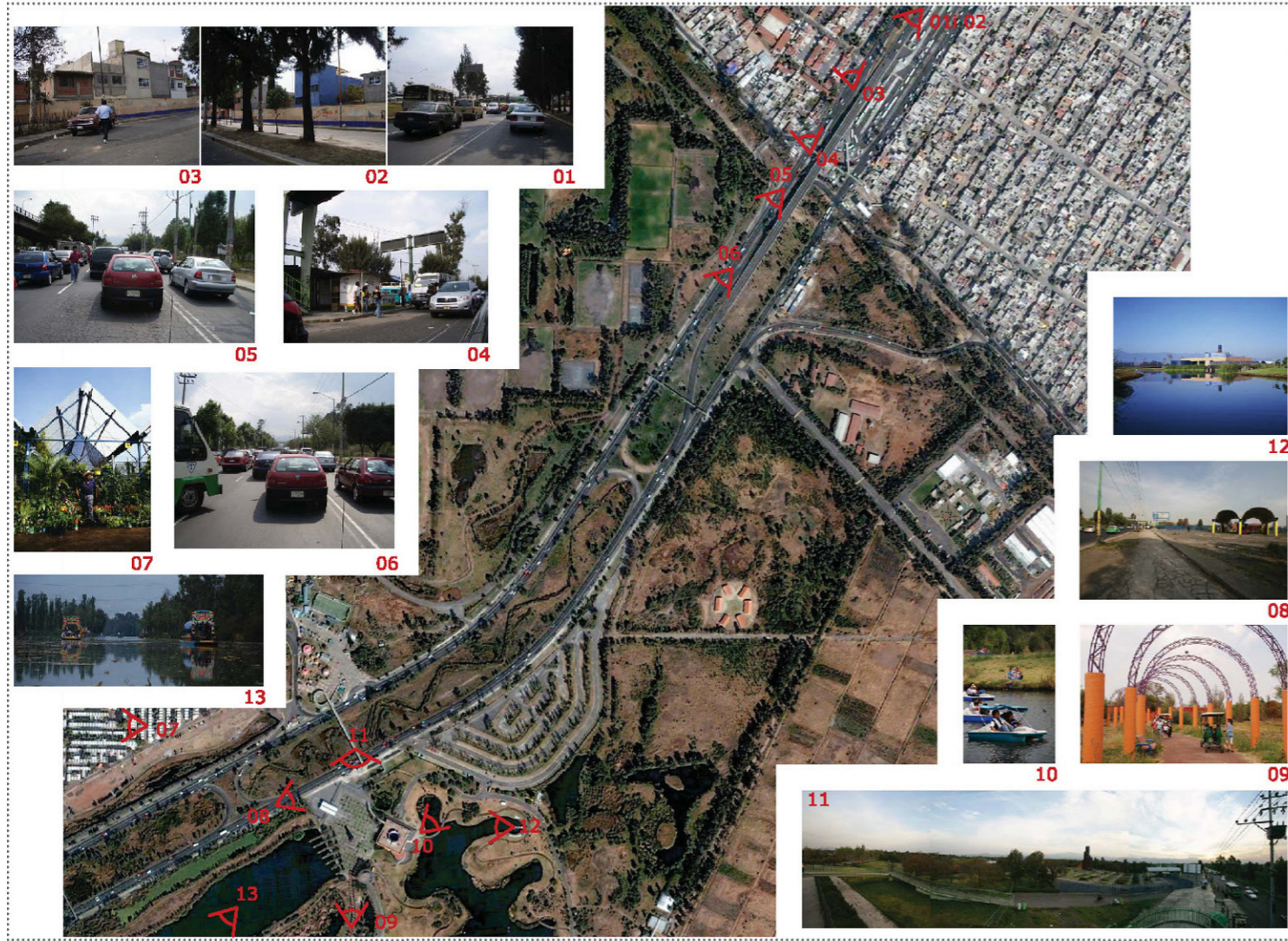
secciones del estado actual esc 1:500

En el proyecto se plantea sobre el cruce del parque natural con el frente edificado de la ciudad y coincidiendo con una estación de la línea de metrobús que rodea la ciudad. La cuña agrícola que se enfrenta a la metrópolis identifica la inexistencia de continuidad urbana en el contexto construido producto de la gran infraestructura que supone el periférico.