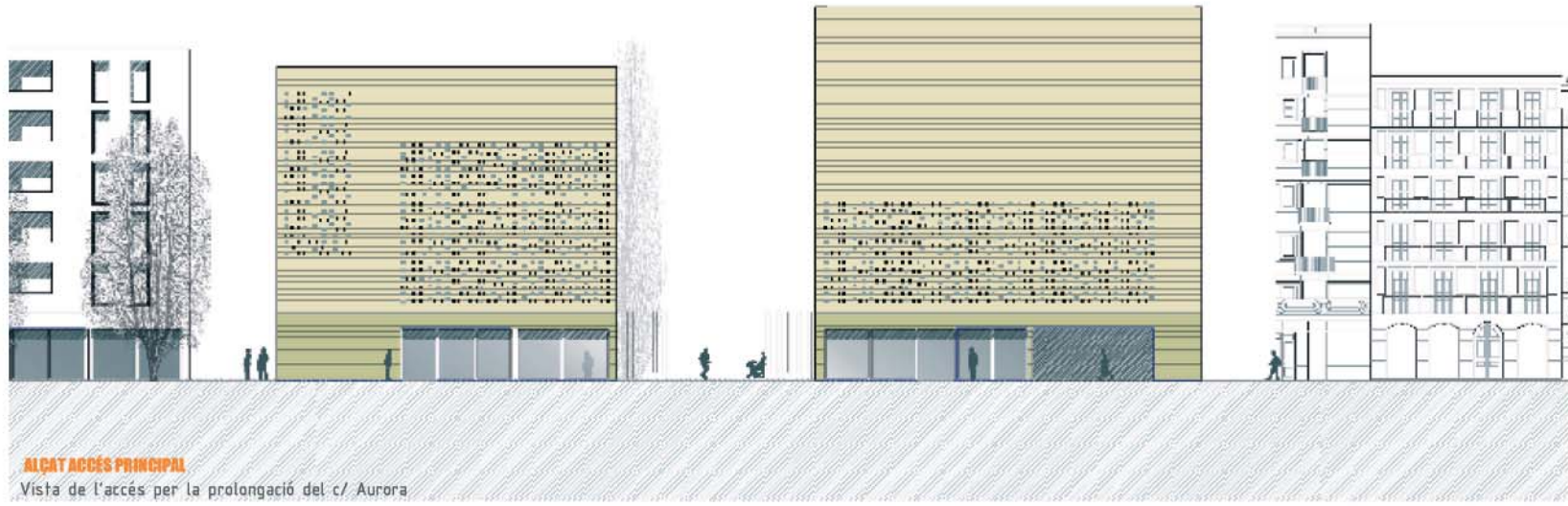
ALÇAT ACCÉS PRINCIPAL Vista de l'accés per la prolongació del c/ Aurora