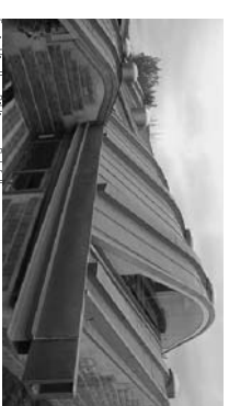
foto d'exterior, Milanesa, Pedras