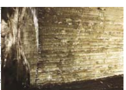
Foto d'interior - Espais de taller Klaus