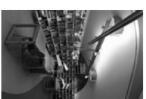
Foto d'interior - Espais de taller Klaus