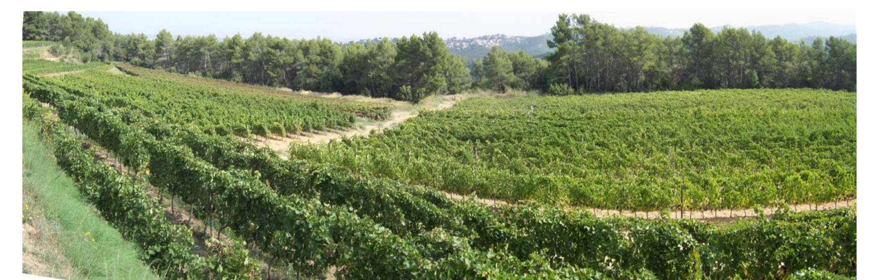
3. Vista de la finca des del camí