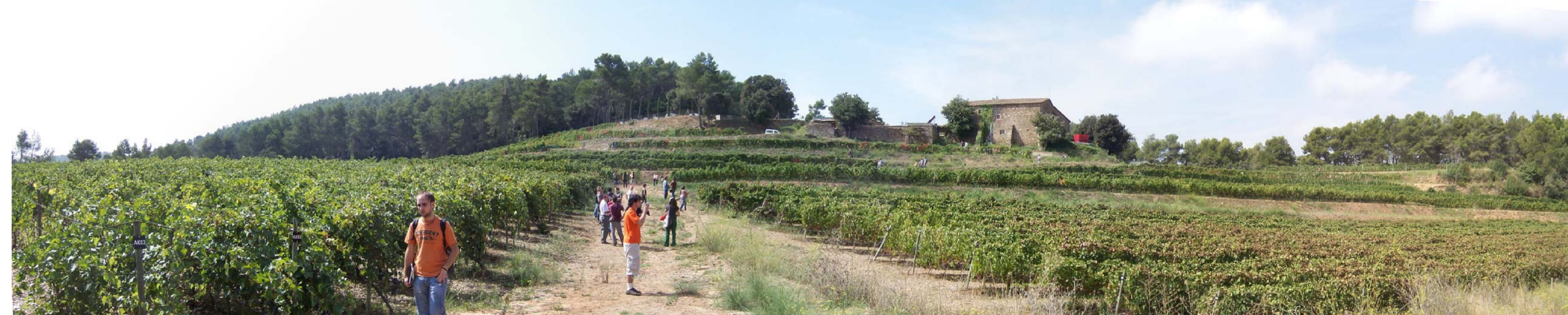
1. Vista de la finca des de la part baixa