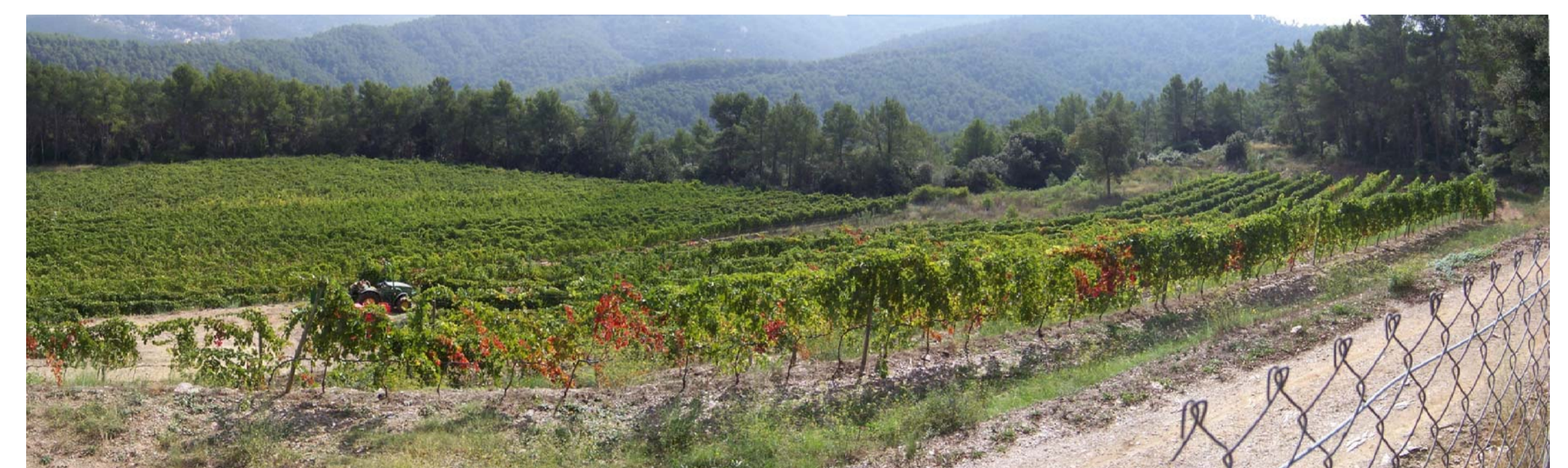
2. Vista de la finca des de l'accés