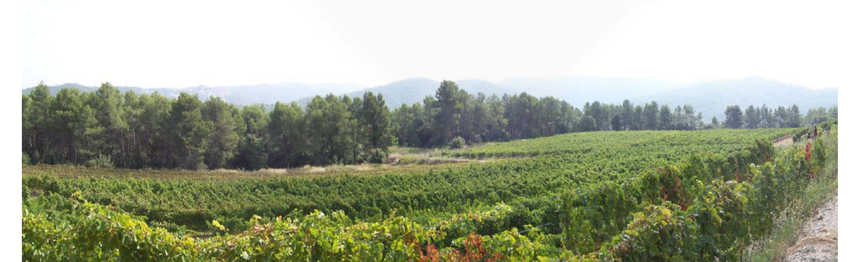
4. Vista des del nord de la finca