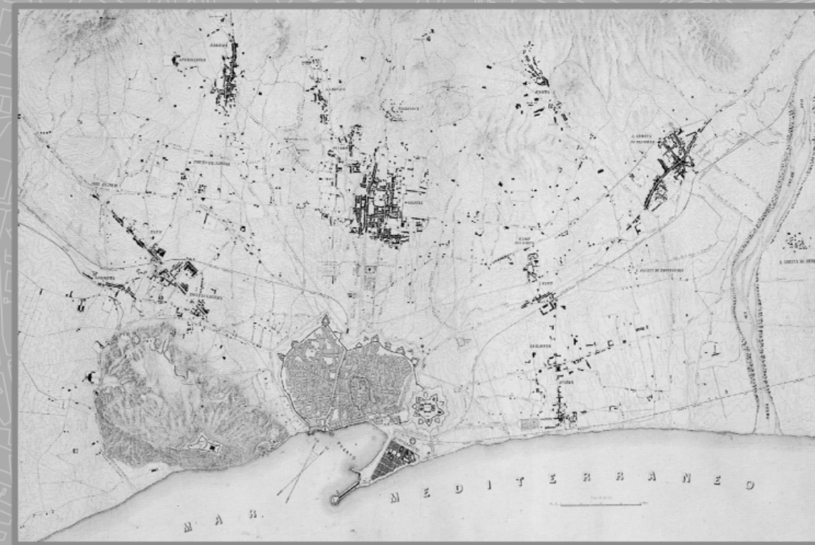
Barcelona i entorns. Avans de l'any 1861

La primera notícia escrita de Sant Andreu de Palomar data de l'any 992, en un document en el qual es consigna un lloc anomenat Palomar. No és fins al 1034 que apareixen junts els noms de Sant Andreu, patró de la parròquia y Palomar. La riquesa principal del poble era l'agricultura de regadiu, gràcies a l'aigua que, des del segle X hi arribava del Rec Comptal, en el seu camí entre Montcada y Barcelona.