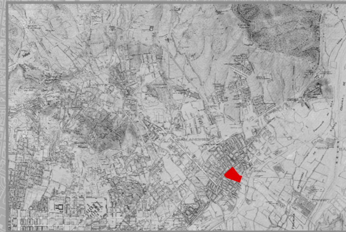
San Andreu. 1929

Al llarg del anys, l'urbanització s'ha anat extenent en petits carrers a l'entorn del carrer Gran, eix principal y antiga via romana. Al final del segle XIX y principis del segle XX, en l'època de la industrialització, ja es troben a Sant Andreu empreses importants i que requerien grans superfícies: Fabra i Coats, La Maquinista, Fabricació Nacional de Colorants... així com una bona quantitat de petites empreses i tallers. El dinamisme econòmic del barri ha anat acompanyat des de sempre, d'una important activitat socio-cultural, que avui es manté amb força.