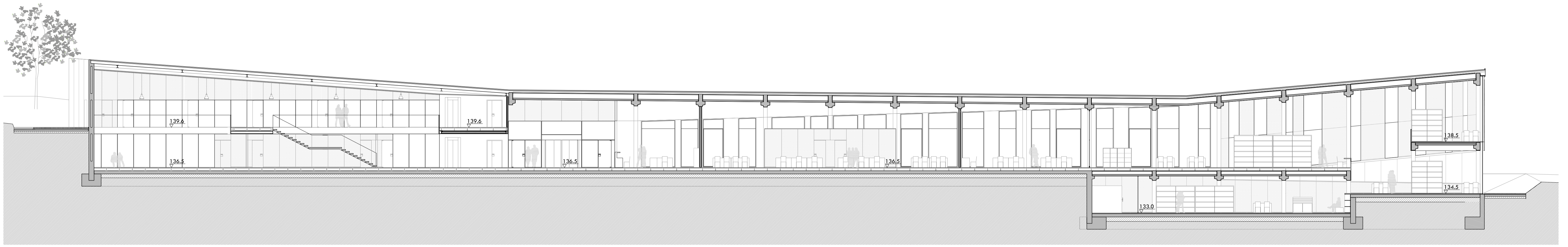
SECCIÓ 1 - TALL LONGITUDINAL MIRANT A NORD - PROJECTA LA CIRCULACIÓ DE LA ZONA D'OFICINES I DESPATXOS ELS ESPAIS DE TREBALL TANT EN GRUP COM INDIVIDUALS I LA BIBLIOTECA AMB ELS QUATRE NIVELLS