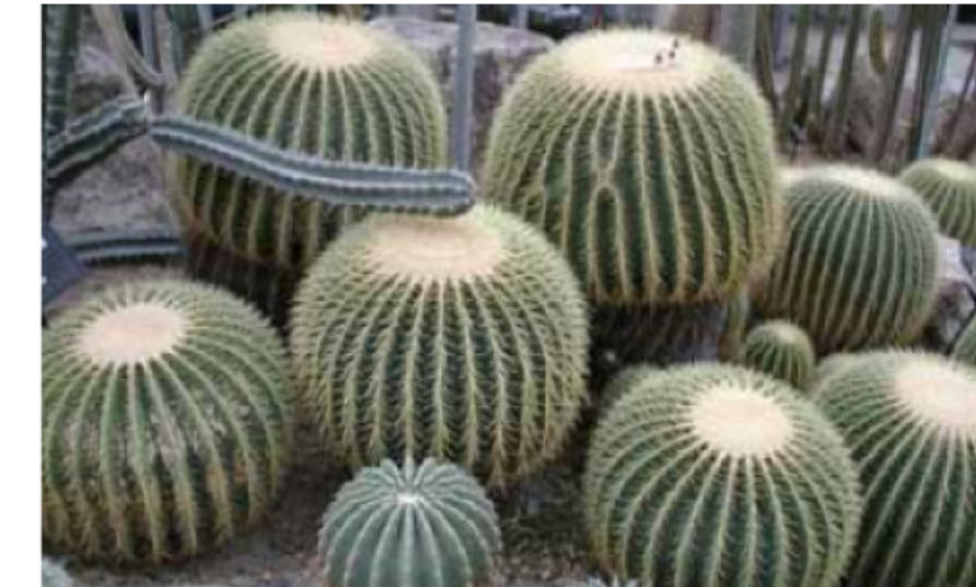
8. Echinocactus grussoni Cactus eriçó