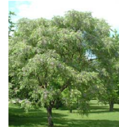
2. Melia azederach Amèlia - Arbre de carrer (igual que al carrer Pere Serra), no requereix rec ni manteniment. Aporta colors rosats a l'estiu i groguencs a la tardor.