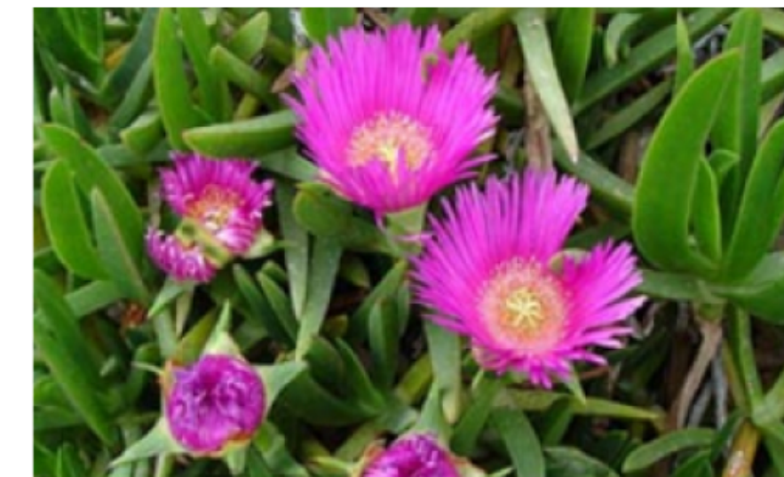
6. Carpobrotus Edulis Dent de lleó