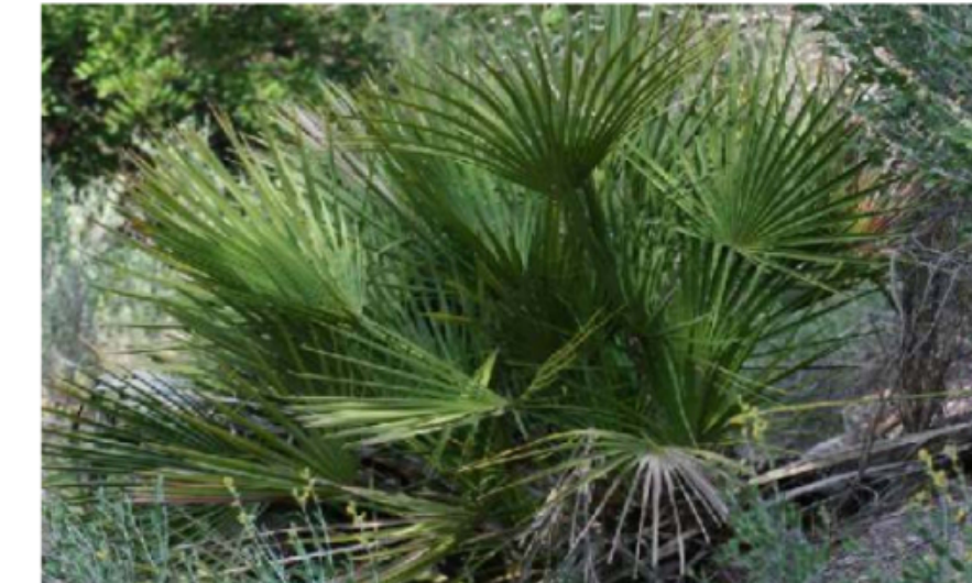
7. Chamaerops humilis Margalló - Per a tanques de separació, no necessita rec ni manteniment.