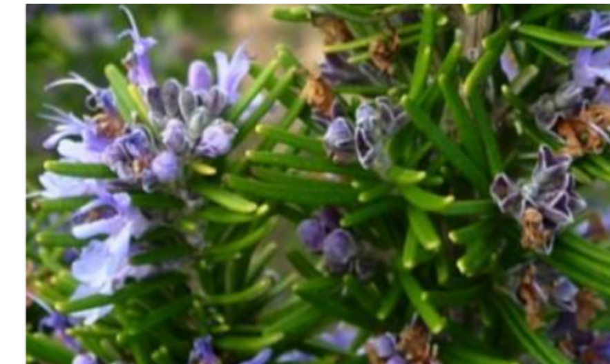
9. Rosmarinus officinalis Romani