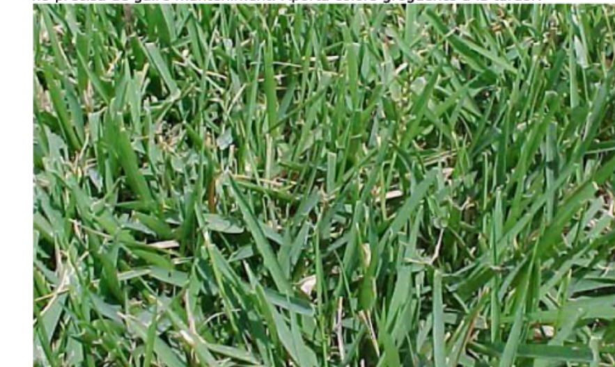
4. Zoysia Japonica Soisia - Tapiçat, requereix poca aigua i no precisa de gaire manteniment. Aporta colors groguencs a l'hivern i verds a la primavera.