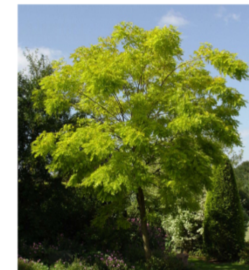
1. Robinia pseudoacacia Càssia - Aplicable en bores de carreteres, no necessita rec ni manteniment. Aporta colors rosats a l'estiu.