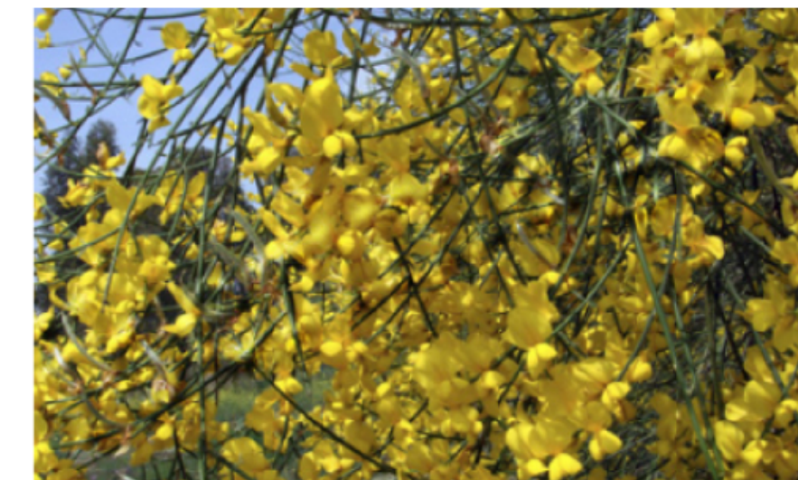
10. Retama sphaerocarpa Ginesta