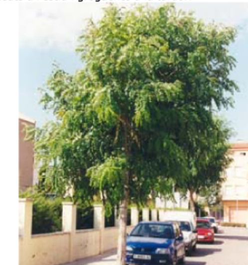
3. Celcís australis Lledoner - Alineació de carrer (igual que a l'aparcament), requereix poca aigua i no precisa de gaire manteniment. Aporta colors groguencs a la tardor.