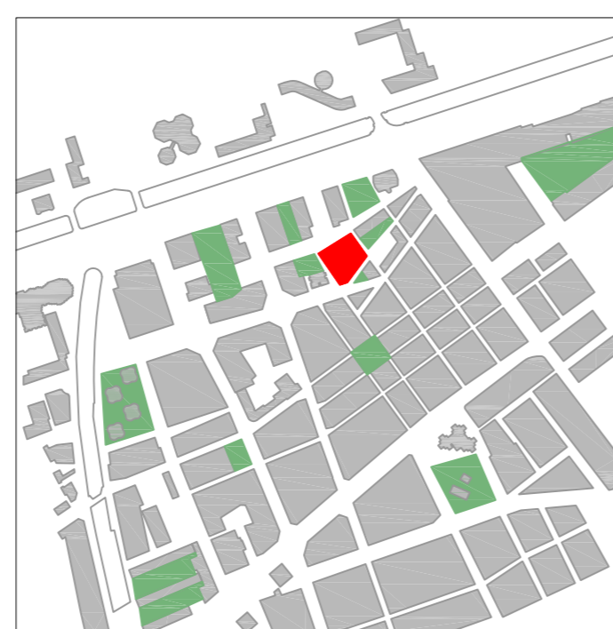
Espais lliures e: 1/10000

La parcel·la està situada a prop d'una important artèria de circulació de la ciutat, la Av. Diagonal, i es connecta amb ella visualment a través d'una plaça. A més està a prop de vies com Numància, Travessera de les Corts o la Gran Via de Carles III.