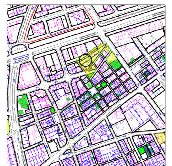
Planol urbanístic e: 1/10000

La parcel·la està situada a un espai de transició entre dues trames urbanes, l'edificació densa i de baixa alçada de les Corts, i els edificis alts que alliberen espai de la Diagonal.