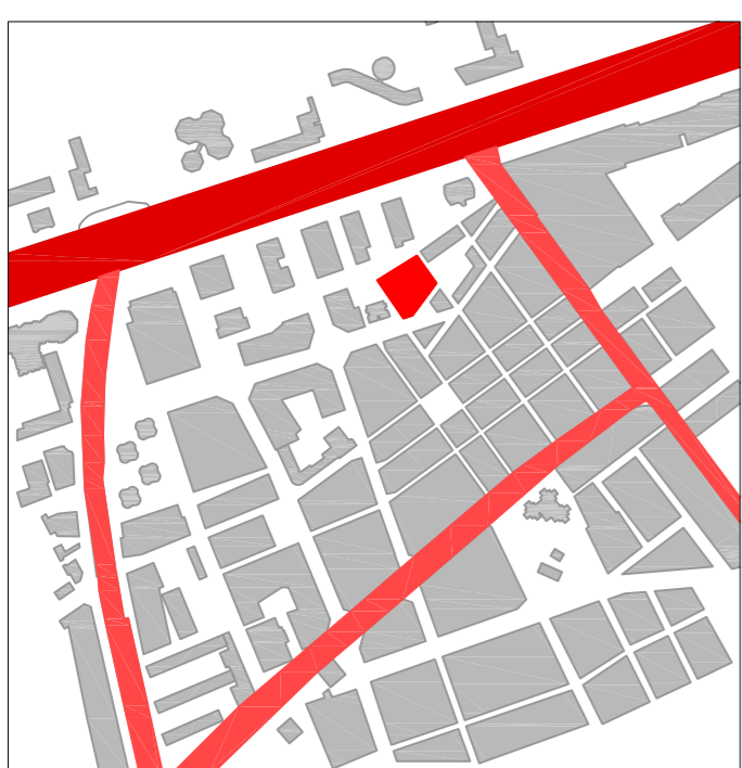
Vies principals e: 1/10000

La parcel·la està situada a prop d'una important artèria de circulació de la ciutat, la Av. Diagonal, i es connecta amb ella visualment a través d'una plaça. A més està a prop de vies com Numància, Travessera de les Corts o la Gran Via de Carles III.