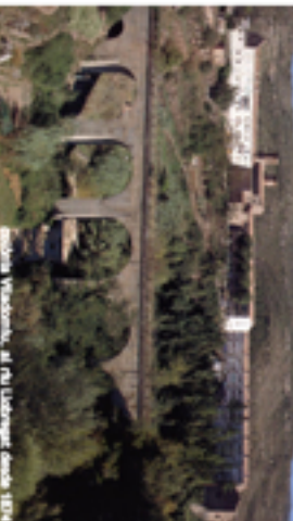
Colònia Viladomiu, al Puig Lluçenç, finals s.19