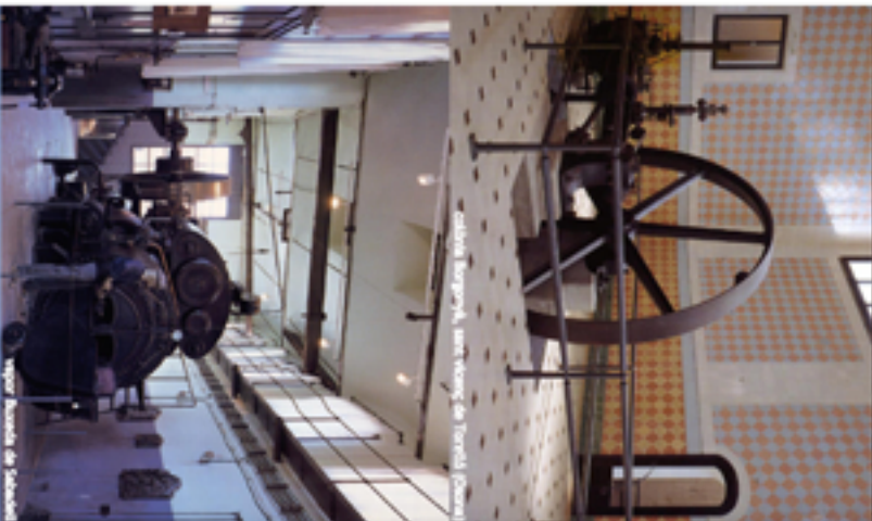
Colònia Viladomiu, Sant Vicenç de Torrada i Castell (interior)