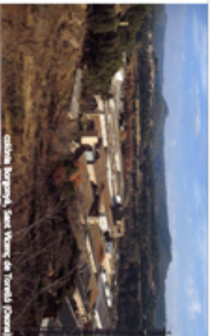
Colònia Viladomiu, Sant Vicenç de Torrada i Castell

Reconecent com a elements del patrimoni industrial, de la qualitat de l'entorn natural en el que es troben i de les infraestructures que les rodegen.